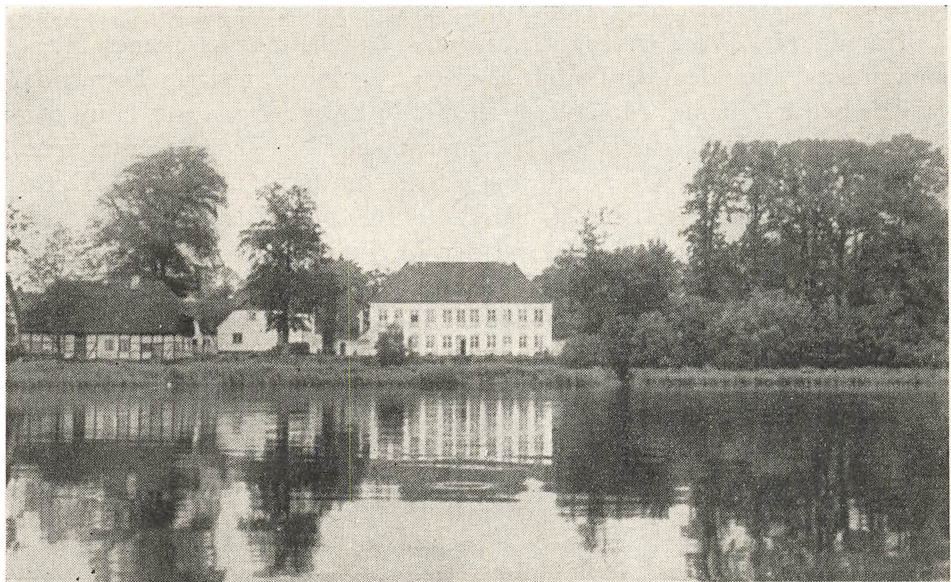
SANDBJERG. Efter Ønske bringer vi Billedet af Sandbjerg i Bladet, da Billedet i Nr. 1 kun fandtes paa Omslaget.

Modersmaal er vort Hjertesprog, kun løs er al fremmed Tale. Det alene i Mund og Bog kan vække et Folk af Dvale.