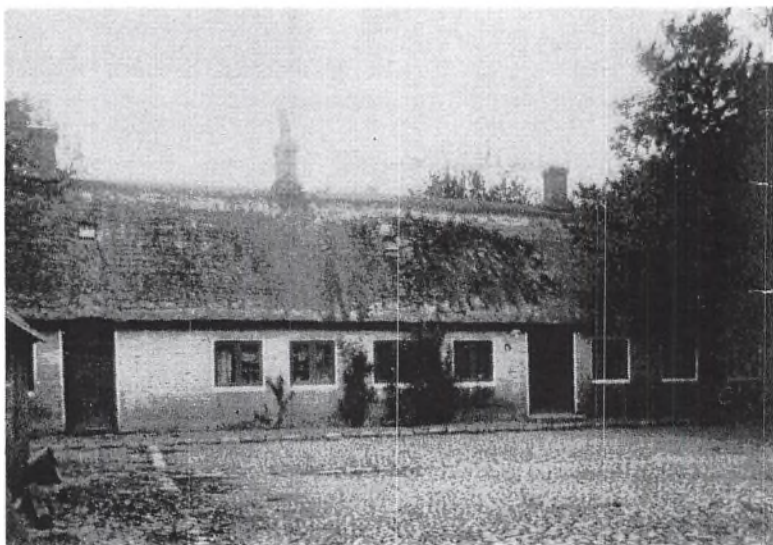
Gammelt billede af stuehuset til ø Hau. Sådan ser det ikke ud mere.

Denne lille bog drejer sig kun om Haverne fra Sdr. Dråby og endda kun om en lille del af disse. Mange grene er ikke ført op til vore dage, hvilket dels kan skyldes, at fornødne oplysninger mangler, dels at det er uoverkommeligt at følge alle grene af slægten.