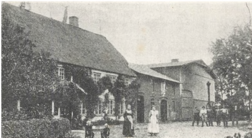
Toldsted omkring Aarhundredskiftet