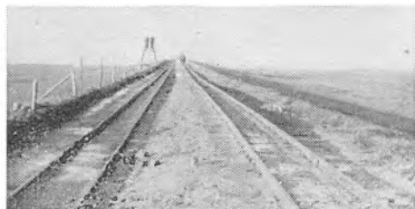
Dæmningen set fra Fastlandet

I det tredie Aarhundrede afløste en Sænkning igen Landhævningen, men nu tog Be-