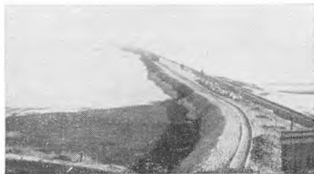
Dæmningen set fra Rømø