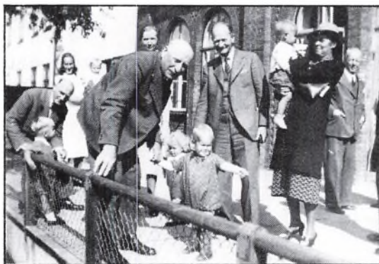
"Kong Peder" som børneven udenfor Børnegården.

Ved indgåelse af lejekontrakten om vuggestuen sikrer selskabet sig forkøbsret til ejendommen. Allerede d. 10. november 1942 ansøges om at udvide med en børnehave på stedet, hvorved også spørgsmålet om overtagelse af ejendommen aktualiseres. Hensigten er, at udvikle stedet til en "Børnegård" med vuggestue, børnehave og fritidshjem. Sidstnævnte ide henlægges dog omkring dette tidspunkt. Den samlede udgift for køb og indretning af Børnegården løber op i 150.000 kr. og pengene blev lånt i sparekassen mod en kommunegaranti. I august 1943 åbnes børnehaven med plads til 80 børn.