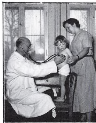
Lægeundersøgelse på Børnegården.

Sagen er vel kort sagt, at man ikke er i stand til at holde trit med udviklingen: Det ekspanderende velfærdssamfund med stigende tilgang af kvinder til arbejdsmarkedet og deraf følgende øget behov for børneinstitutioner, boliger m.m.