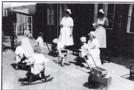
Børn og medarbejdere på Børnegårdens legeplades.

Man må her også betænke, at vi befinder os i krigstiden og efterkrigstidens mangelsamfund. Udbygningen af den offentlige sektor, herunder børneinstitutioner, har endnu ikke taget fart, og brugernes betalingsevne er tydeligvis begrænset. Det giver nogle specielle betingelser, når man vil lave socialpolitik i lokalsamfundet, hvad der jo dybest set er tale om.