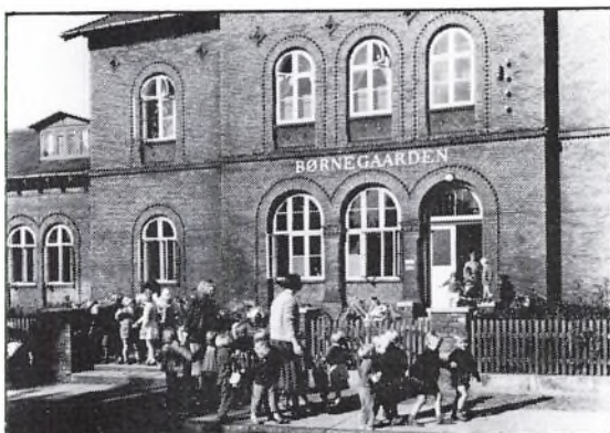
Børnegården på Trækbanen 16.

Ved indgåelse af lejekontrakten om vuggestuen sikrer selskabet sig forkøbsret til ejendommen. Allerede d. 10. november 1942 ansøges om at udvide med en børnehave på stedet, hvorved også spørgsmålet om overtagelse af ejendommen aktualiseres. Hensigten er, at udvikle stedet til en "Børnegård" med vuggestue, børnehave og fritidshjem. Sidstnævnte ide henlægges dog omkring dette tidspunkt. Den samlede udgift for køb og indretning af Børnegården løber op i 150.000 kr. og pengene blev lånt i sparekassen mod en kommunegaranti. I august 1943 åbnes børnehaven med plads til 80 børn.