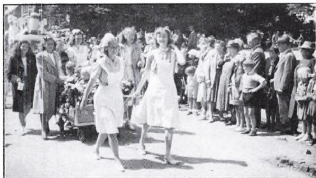
Børnehjælpsdag. Børnegården deltager i optog.

Selskabet forsøger løbende at finde alternative indtægtskilder, bl.a. gennem private bidrag. Om disse hedder det i beretningen for 1946: "...de private bidrag til Mødre- og Børnehjælpens virksomhed her i byen har været en skuffelse, hvilket gælder alle kredse af byens befolkning". Andre muligheder var basarer og børnehjælpsdage. I 1947 var børnehjælpsdagens overskud 24.000 kr., i 1948 27.000 kr. En væsentlig del heraf gik til Børnegården, men også andre børneinstitutioner blev tilgodeset.