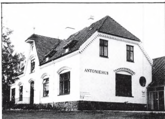
Fødeklinikken Antoniehus på Flynderborgvej.

I perioden 13.12. 1946 til 31.12. 1947 har ialt 264 mødre benyttet Antoniehus. Heraf kommer 214 fra Helsingør kommune, 73 fra Tikøb og 7 fra andre kommuner. Ligesom på Børnegården er der tale om hele eller halve fripladser.