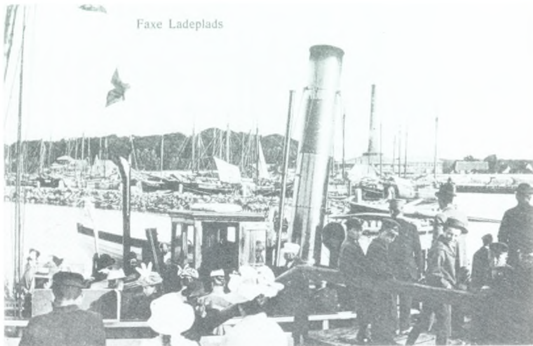
Udflugtsdamperen i Faxe Ladeplads Havn.