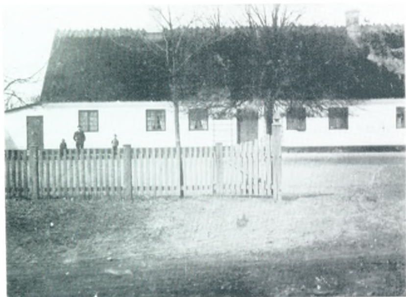
Bisserup Skole, ca. 1910.

Hvor langt fra dem derhjemme jeg end skal søge Ly, jeg aldrig dog kan glemme min kære Fødeby. J. Danielsen.