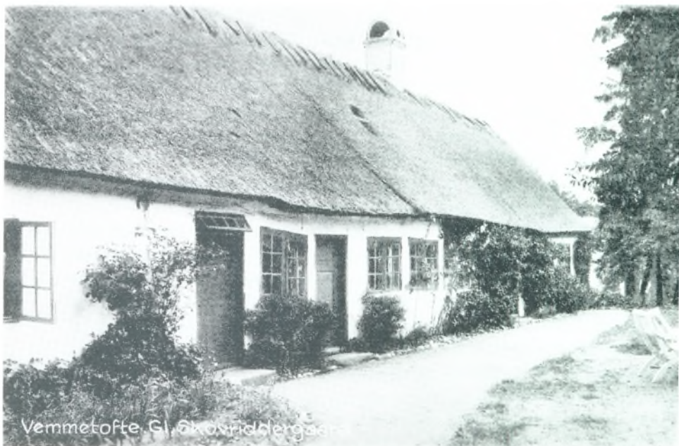
Gl. Skovriddergaard, Vemmetofte Strand.