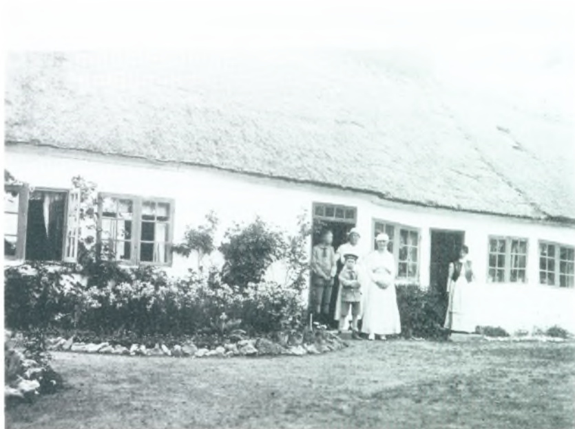
Feriegæster ved Gl. Skovridergaard.