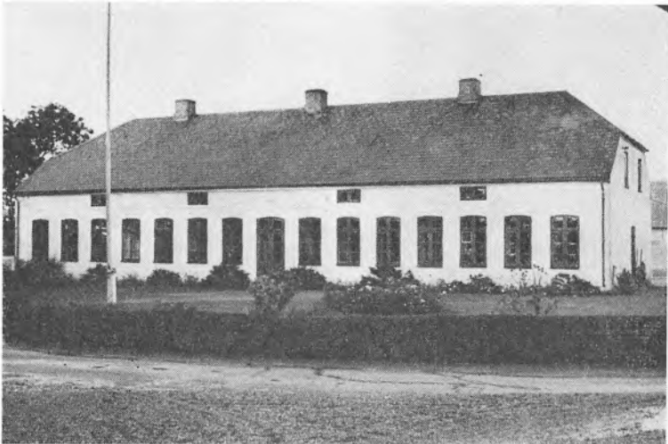
Barndomshjemmet i Høgslund.

Redaktøren af Flensborg Avis var den, der først lærte os at sætte et lys i vinduet, så de nationalt vildledte kunne finde hjem. Hans modige og ukuelige protest mod den tyske uretfærdighed – der mange gange førte ham i tysk fængsel – hans urokkelige tro på vor ret var med til at skabe det mod og den fortrøstning, der fik Nordslesvig til at holde stand mod tvangsstyret i 56 år.