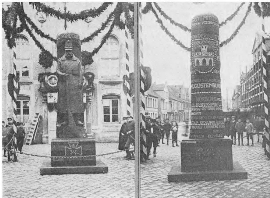
For- og bagsiden af Jernlandstormsmanden, der var anbragt foran Rådhuset i Sønderborg. (Foto: Sønderborg Museum).

havde hver klasse jo lejlighed til at slå en guldnagle i. Værre var det med de små énklassede skoler. De havde ikke så let ved at skaffe de 50 mark, som var nødvendige til en guldnagle. Fra en sådan lille landsbyskole på Sydals foreligger et brev fra læreren til kredsskoleinspektøren, hvori han meddeler ham, at det kun er lykkedes ham at samle 11,70 mark, som han stiller til rådighed, da det jo ikke er nok til en guldnagle alligevel, tilmeld da børnene har meddelt ham, at for de indsamlede penge skulle rejsen til Sønderborg til evt. nagleislagning også bestrides. Kredsskoleinspektøren foreslår ham i sit svar at alliere sig med de to små skoler i sognet, så alle tre skoler måske i fællesskab kunne erhverve én stor guldnagle. Hvordan løsningen blev, vides ikke. Skolerne på landet fik i november måned 1915 lejlighed til at deltage i nagleislagningen. Det skete i dagene den 16., 18. og 19. november. Forud gik lange forhandlinger med amtsbanerne på Als om eventuelle ekstratog og om nedsættelse af billetpriserne. Hvert barn, der i de dage deltog, fik udleveret 1 -ét - jernsøm og et dokument om deltagelsen.