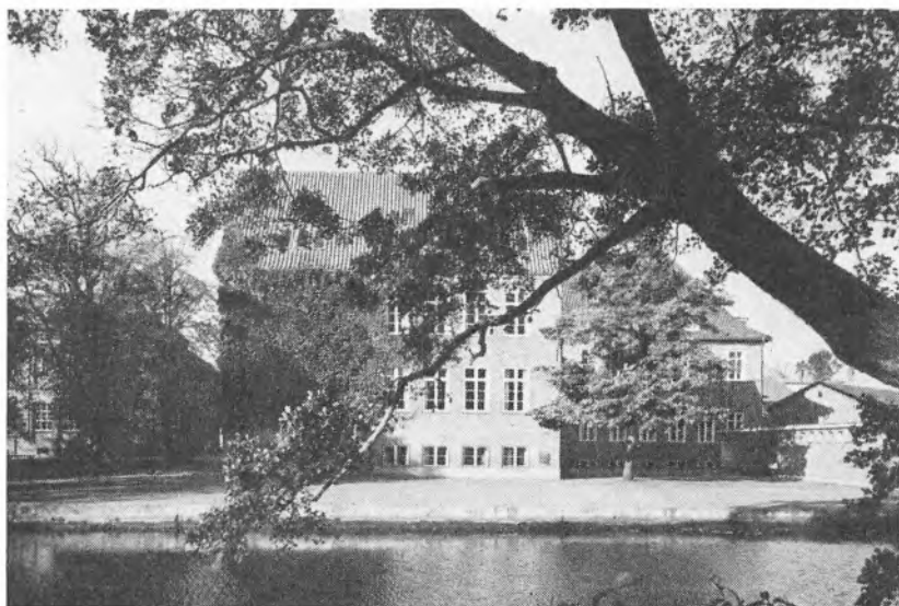
Tønder statsseminarium set fra anlæget