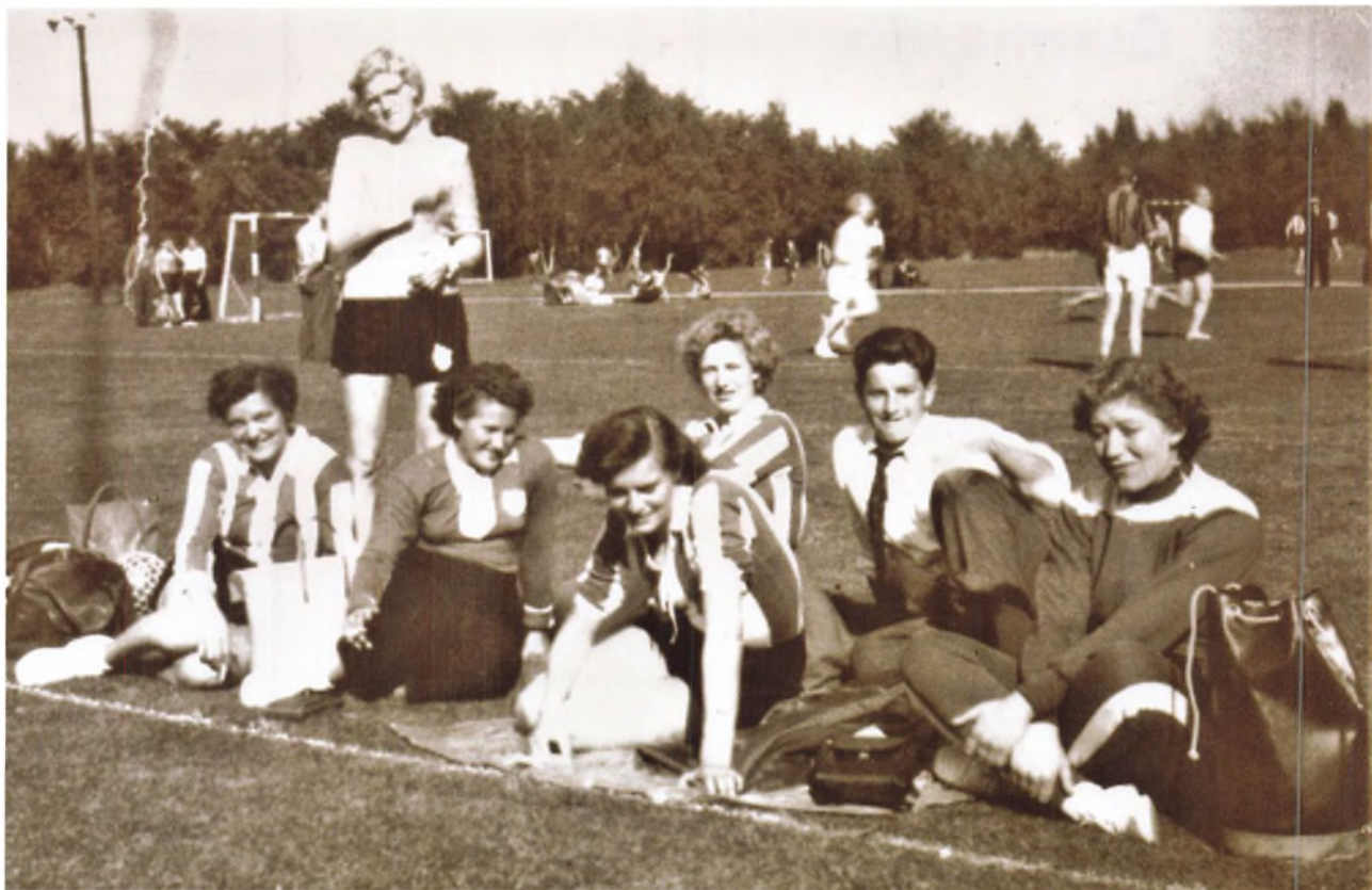
TIIF's Håndbold - Damestævne 1954