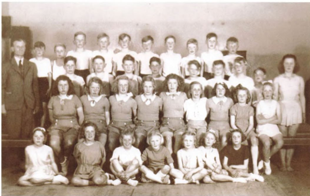
TIIF's Gymnastik i Borrevejle 1953