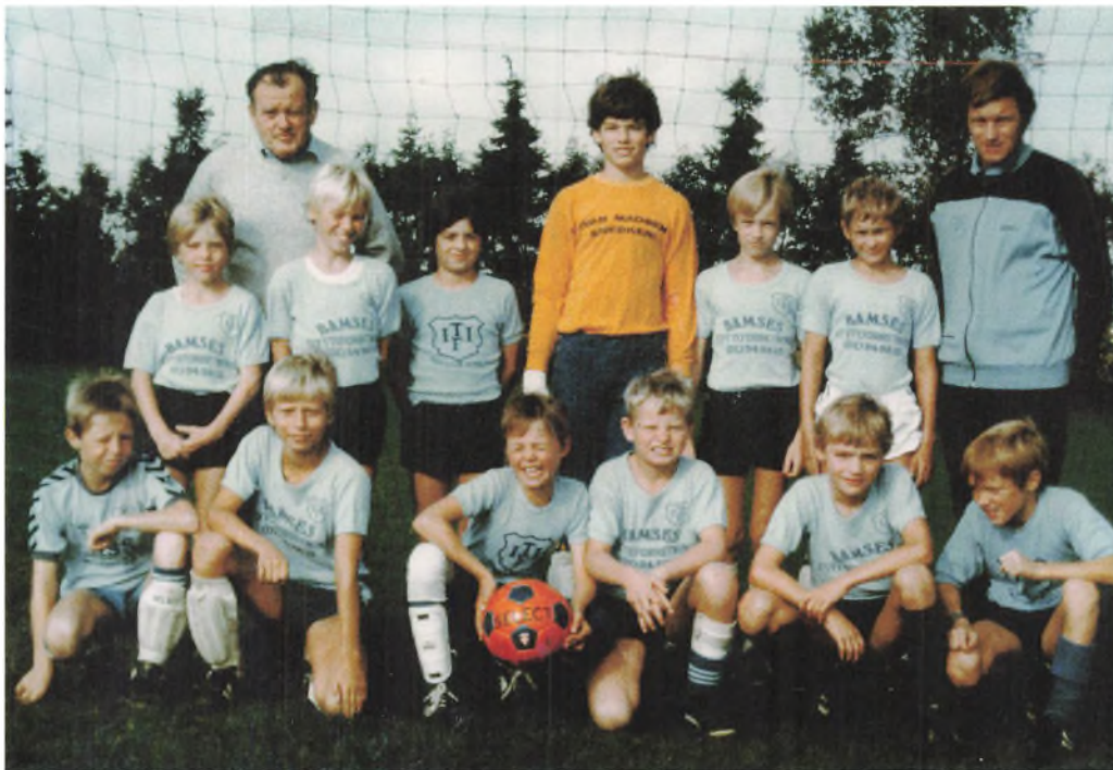
TIIF's fodboldhold Lilleput 1984