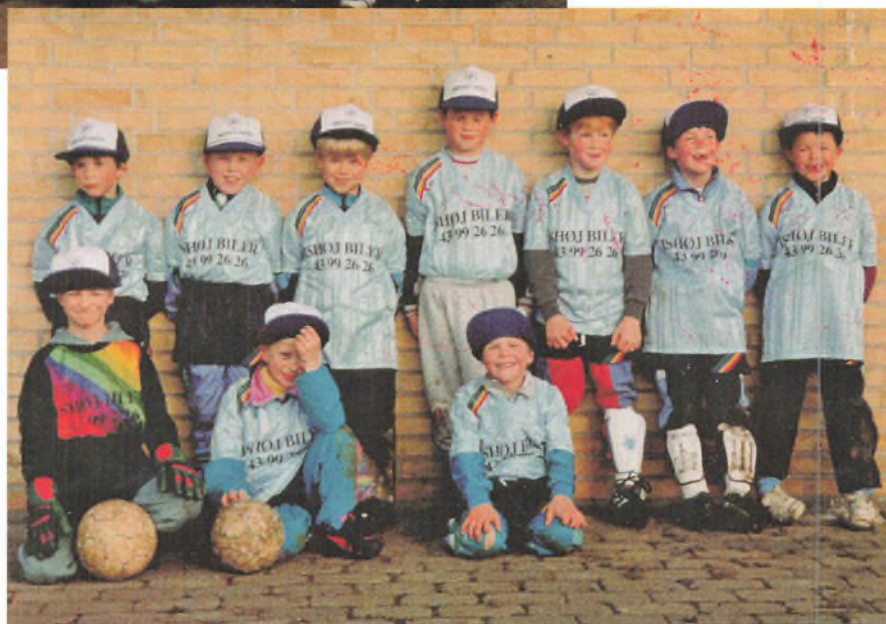
Lilleput fodbold 1994