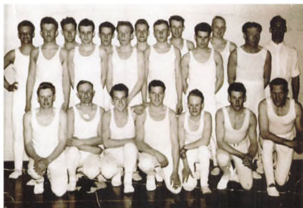
TIIF's Gymnastik Herrehold 1957