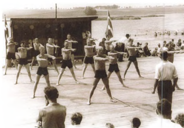
TIIF's Gymnastik i Borrevejle 1953