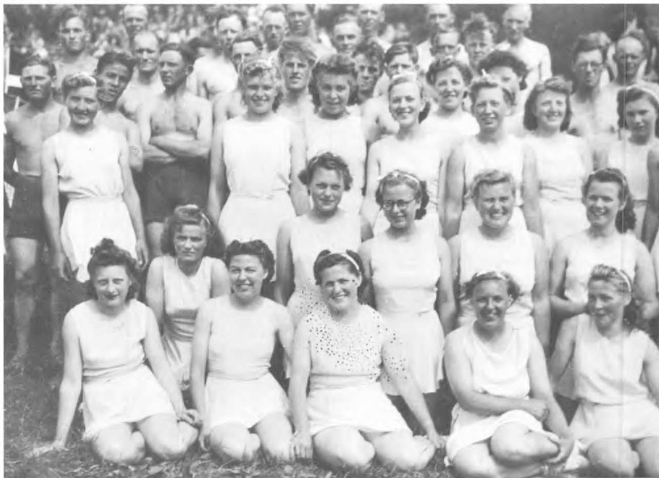
Gymnastik i Borrevejle 1943