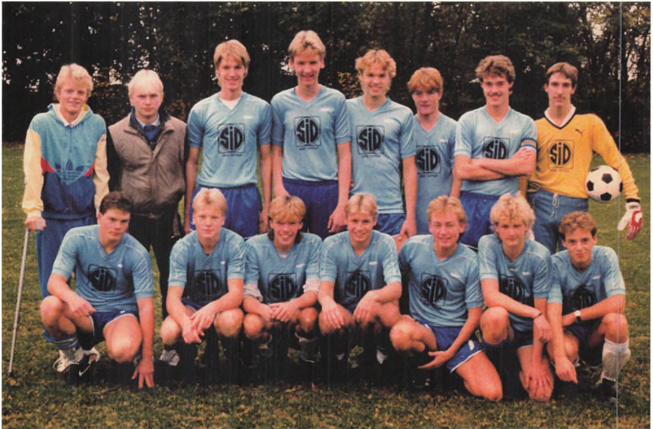
TIIF's fodboldhold Ynglinge 1987