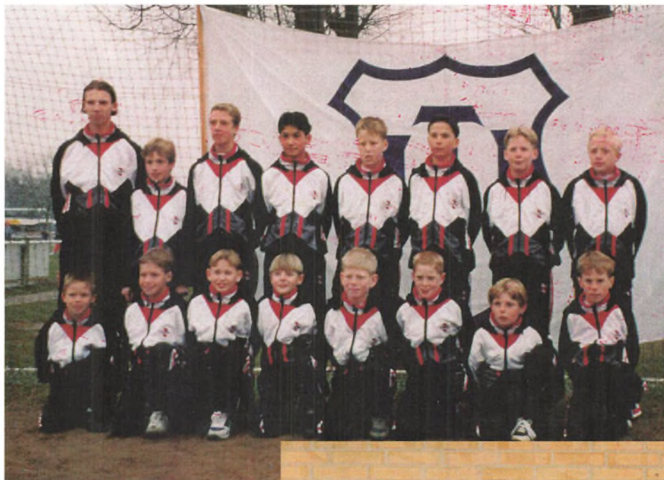
Lilleput fodbold 1983