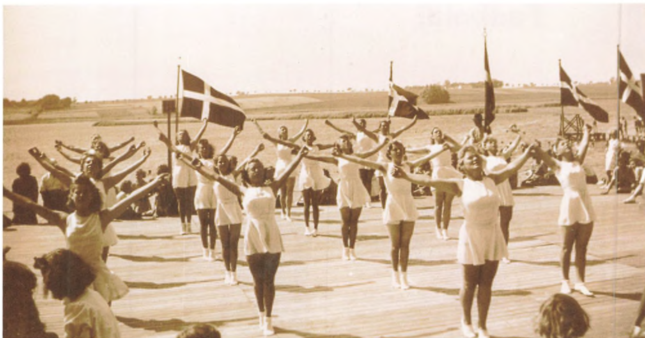
TIIF's Gymnastik i Borrevejle 1941