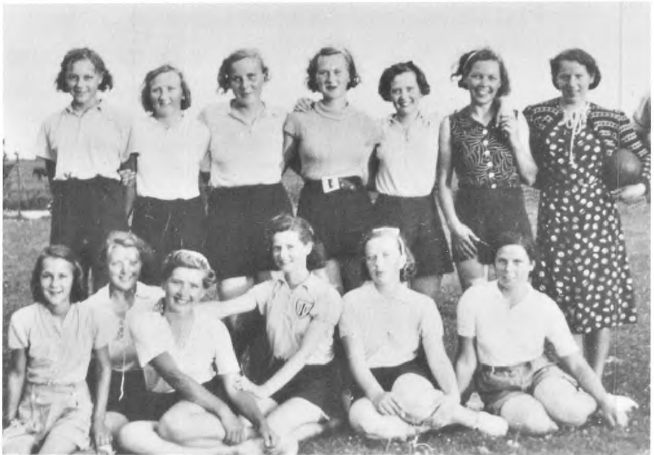
TIIF's Håndboldbold træningsaften 1941