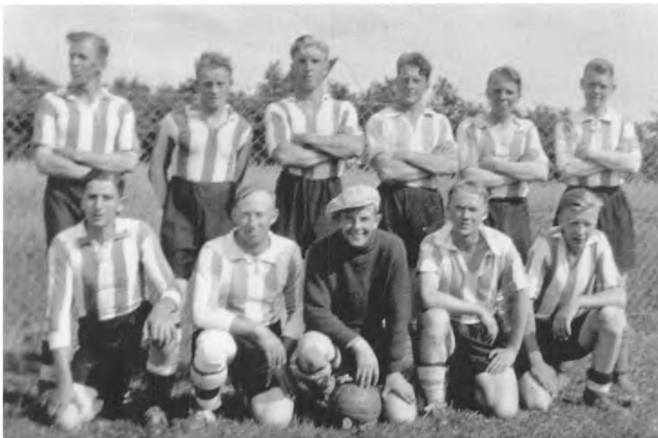
TIF's fodboldhold 1940/41