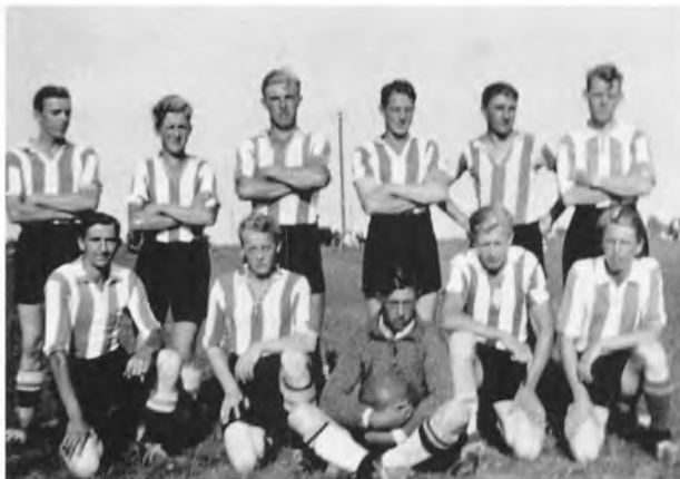
TIIF's fodboldhold 1937

op i mellemrækken. Holdet blev aldrig fortrængt fra mellemrækken, men i 1943 bad foreningen selv om at blive flyttet tilbage i A-rækken.