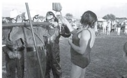
Sportsuge 1971 Vandkamp mellem Falck, Taastrup og TIIF