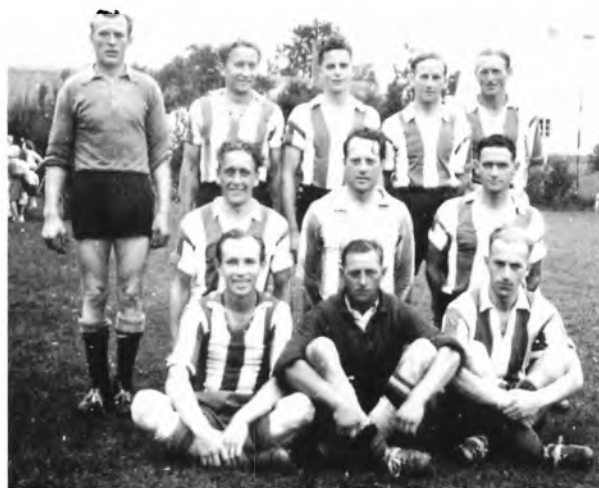
TIIF's fodboldhold 1938

Hvor mange medlemmer, der var med i klubben fra start, melder historien intet om, men et rundt tal må være, ikke under de to sognes fodboldhold, altså 22 fodboldspillere.