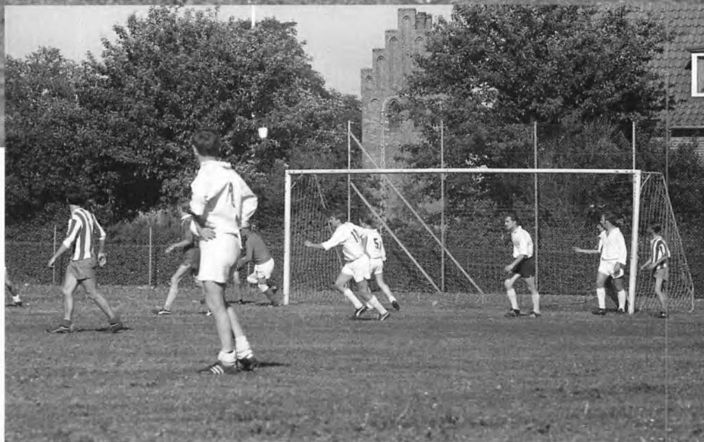
TIIF's fodboldhold Voksen Juni 1972