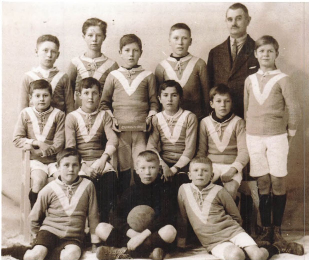
TIIF's fodboldhold Drenge 1928