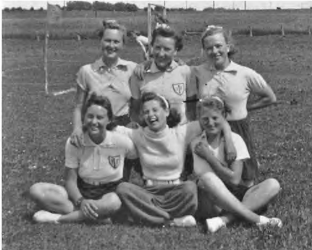
TIIF's Håndbold - Kanonholdet 1940

Håndboldtræningen kunne først starte i begyndelsen af maj måned, for der var ingen indendørs faciliteter. For både piger og drenge var interessen stor for at deltage i håndbold.