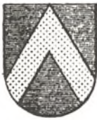
Ätten Sparres vapen