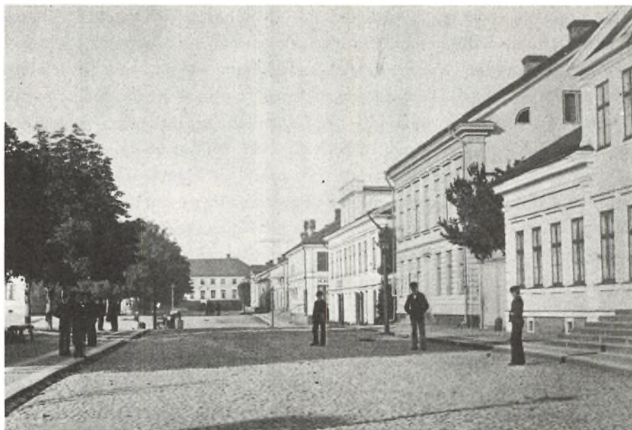
Växjö på 1800-talet