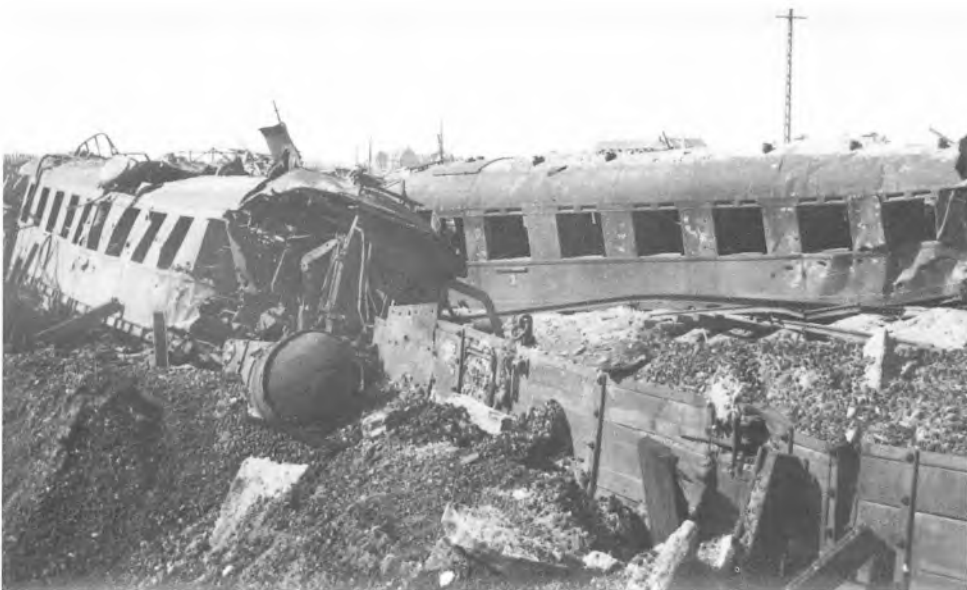
Den østlige længdebane gik gennem Bjolderup sogn og blev et mål for jernbanesabotagen. Billedet her viser sandsynligvis afsporede tog mellem Bolderslev og Hjordkær den 27. september 1944. Aktionen afbrød trafikken i 42 timer.

Efter at tyskerne den 15. september 1944 havde deporteret 197 fanger fra Frøslevlejren til Neuengamme, var Børge Andersen med til at udbrede en folkestrejke i Sønderjylland. Strejken startede