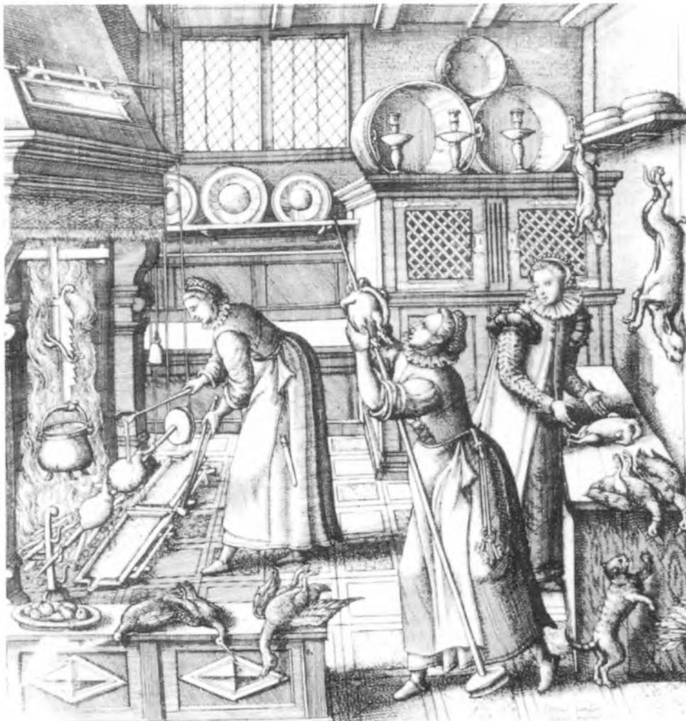
Kobberstik fra 1500-tallet, der viser køkkenet i et herskabshus, hvor der steges ved kaminildstedet. 200 år senere foregik tilberedningen stadig over det åbne ildsted.

dant stadskok-privilegium udstedt endnu tre gange i løbet af de følgende årtier, sidste gang i året 1717 af Kong Frederik IV. Det var først en gruppe kokke, der fik tildelt privilegiet, og herefter blev det udvidet til enkelte, senere tilkomne ansøgere. 4) Det er således en ret overskuelig mængde skriftlige kilder, der beretter om