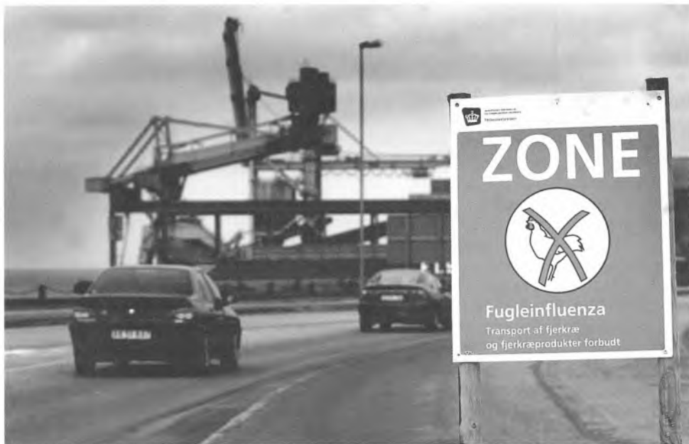
Hele Als og Sundevedområdet helt til Aabenraa blev sat under overvågning efter fund af en musvåge med fugleinfluenza i Sønderborg Lufthavn.