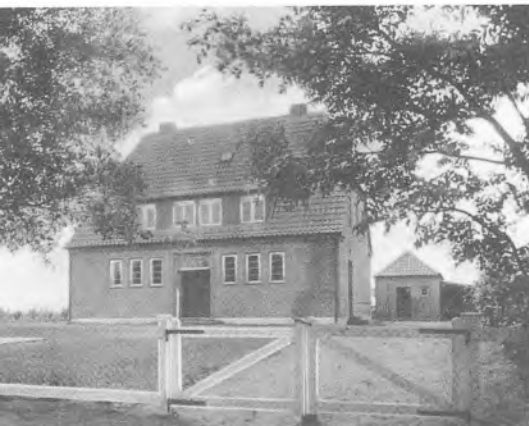
Det tyske arbejde havde også i Bjolderup sogn et fast holdepunkt i privatskolerne og deres lærere. Den tyske privatskole i Rebbøl var grundlagt i 1933.

At lægge om nu [skifte navn til DNU] er en offensiv«.