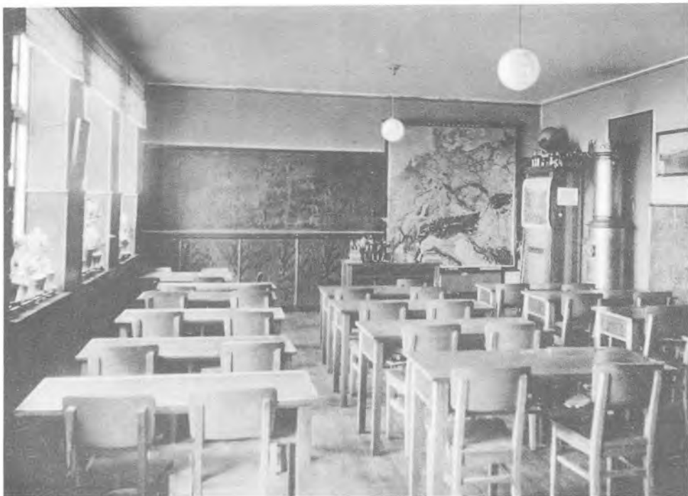
Klasseværelse i Rebbøl tyske privatskole. I besættelsesårene havde skolen i snit lidt over 30 elever. Brevkort: Museum Sønderjylland.