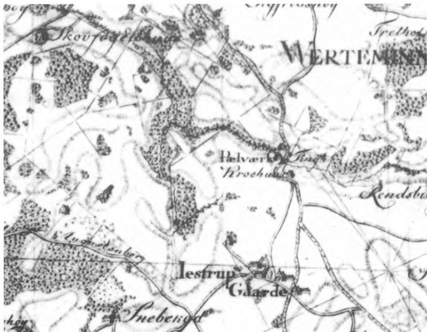
Udsnit af Videnskabernes Selskabs konceptkort fra ca. 1770.

Med Hertug Hans den Yngres overtagelse af Gammelgård i 1584 blev bøndernes hoveriarbejde mere omfattende, og stort set alle hoveriarbejdere (husmænd og bøndernes karle og piger) fra hele det sydøstlige Als (Tandslet, Tandselle, Ertebjerg, Sarup og Mommark) har dagligt passeret Pæleværk på vej frem og tilbage til hoveriarbejdet. Vejen fra Sydøstals (undertiden benævnt hoverivejen eller