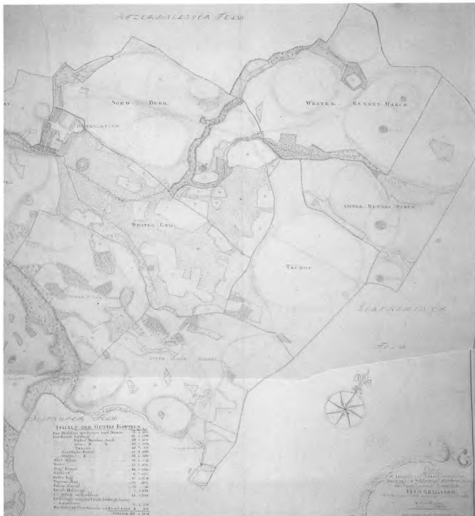
Kort fra 1796 over den østlige del af Gammelgårds marker.

med både eller pramme helt frem til Pæleværk har området været forholdsvis tæt befolket i oldtiden. Området vrimer med stenalderredskaber, og der er påvist flere bronze- og jernalderboplader. Også i vikingetiden har der været en betydelig befolkningskoncentration i området omkring Augustenborg Fjord og Mjangedam.