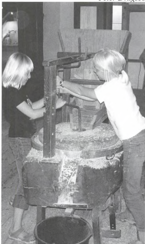
Mel og mølle-aktivitet på Dybbøl Mølle juli 2005