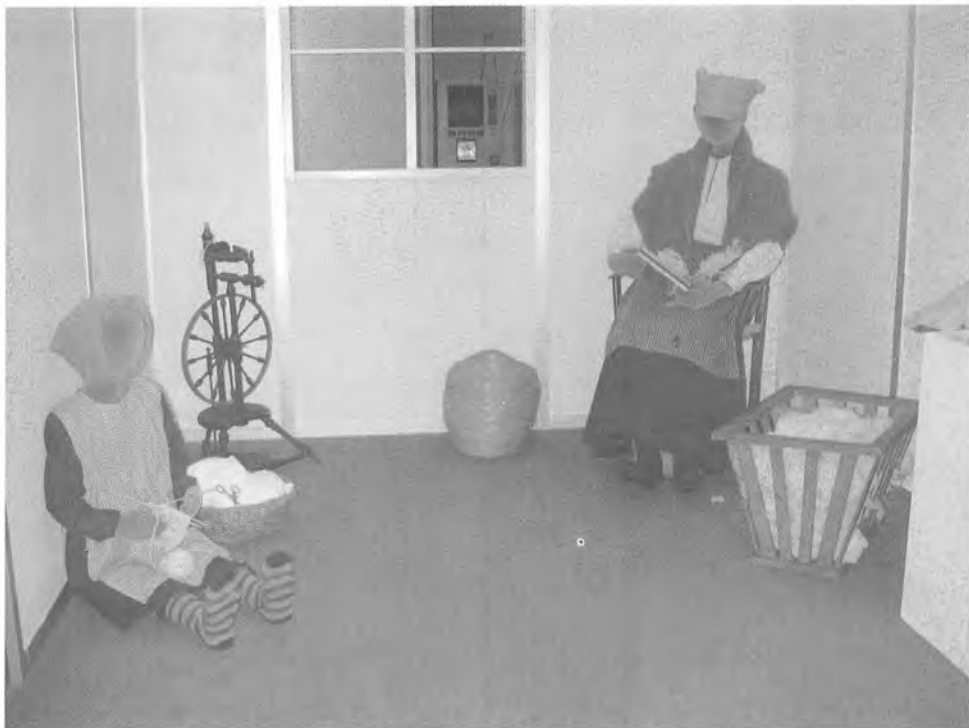
Interiør fra udstillingen «Fattiggårde på landet i Sønderjylland», Haderslev Museum 2003.

Der kunne pigen komme to måneder før fødslen og op til to måneder efter, medens hun ammede, så barnet kunne overleve (altså mod betaling, hver en ting er noteret op).