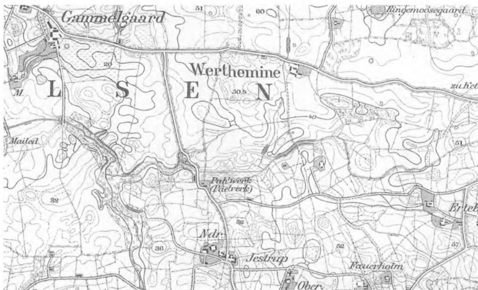
Udsnit af preussisk målebordsblad u.å. Her nævnes navnet Pahlwerk/Pæleværk.

Pulverbækken har tidligere heddet Erdbeck eller Ertebæk, jf. Meiers kort. Forstavelsen Erd eller Ert, der også fin-