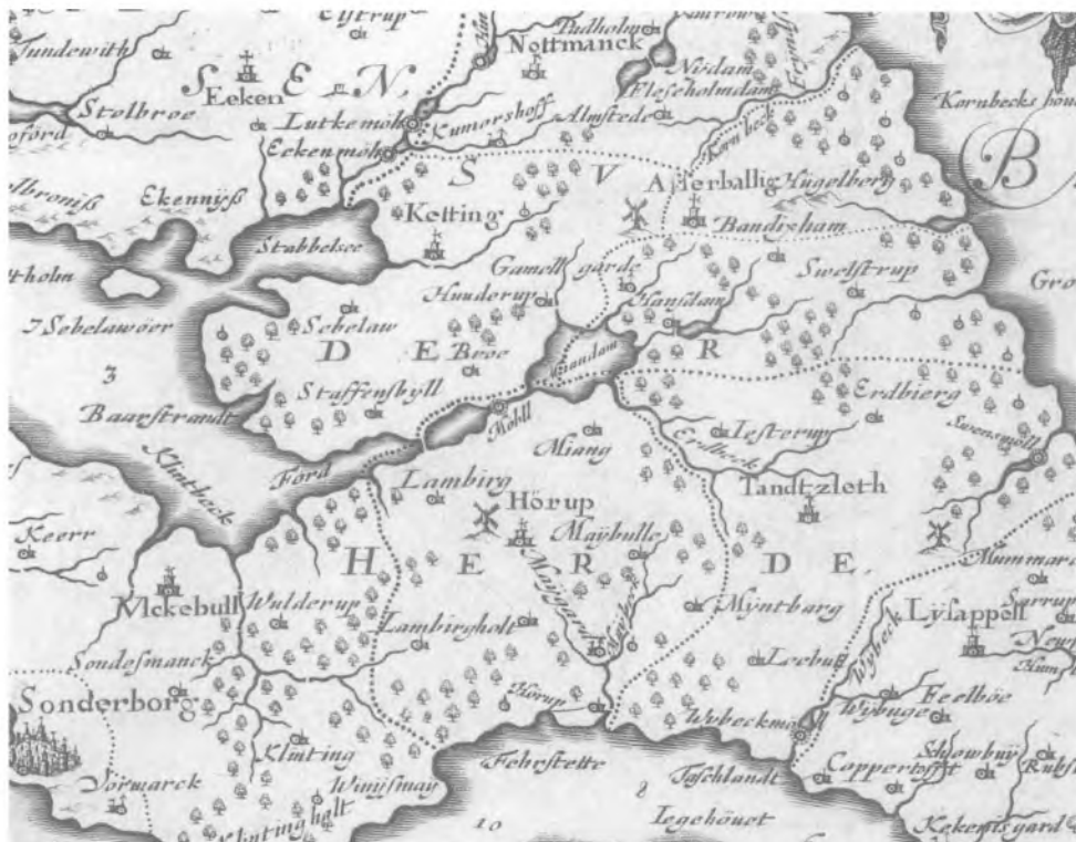
Udsnit af Meiers kort over Als fra 1641. Landsarkivet.

des i Ertebjerg, kommer formentlig fra det tyske Erde, der betyder jord. Oprindelsen til navnet Pulverbæk, kendes ikke. Måske kommer det af Pæleværkbæk, eller måske stammer det fra det alsiske polfer, der kan betyde en rivende strøm eller et kraftigt vandløb.