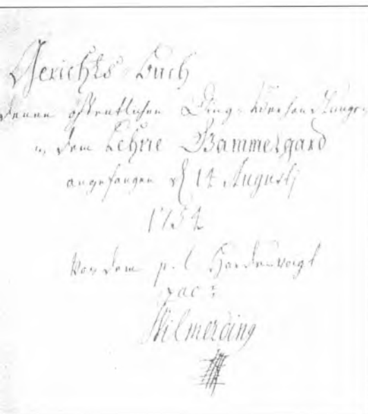
Titelsiden fra tingretsprotokollen for Gammelgård Lens Ting fra 1754.

hertugvejen) gik over broen ved Pæleværk og løb 30-40 meter langs slugten på dennes nordøstside og derfra skråt over til Gammelgård, jf. Gammelgårds markkort fra 1796. Dette sidste stykke af vejen er nu nedlagt, og det er i dag stort set ikke muligt at påvise spor af den.