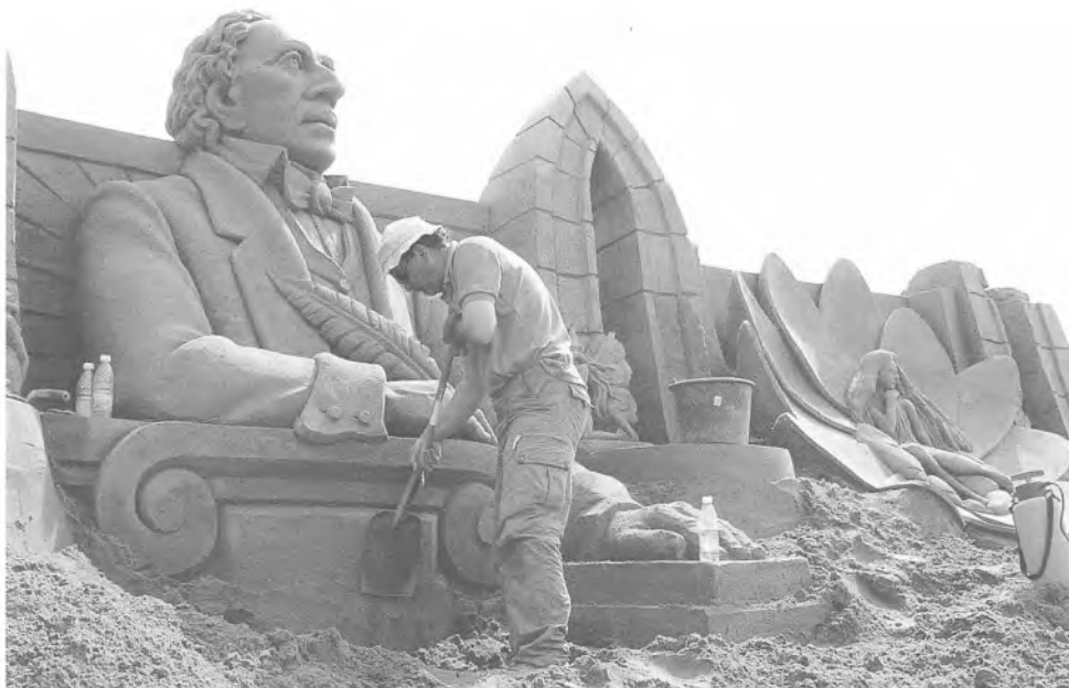
H. C. Andersen er temaet for dette års sandskulpturfestival på Rømø. Foto: Elise Rahbek. Der Nord-schleswiger.

14. maj: Folketinget fastholder, at skat-tecentret skal gå udelt til Tønder, som derved får 357 nye arbejdspladser. Sønderborg håbede til det sidste at få en del af kagen (JV).