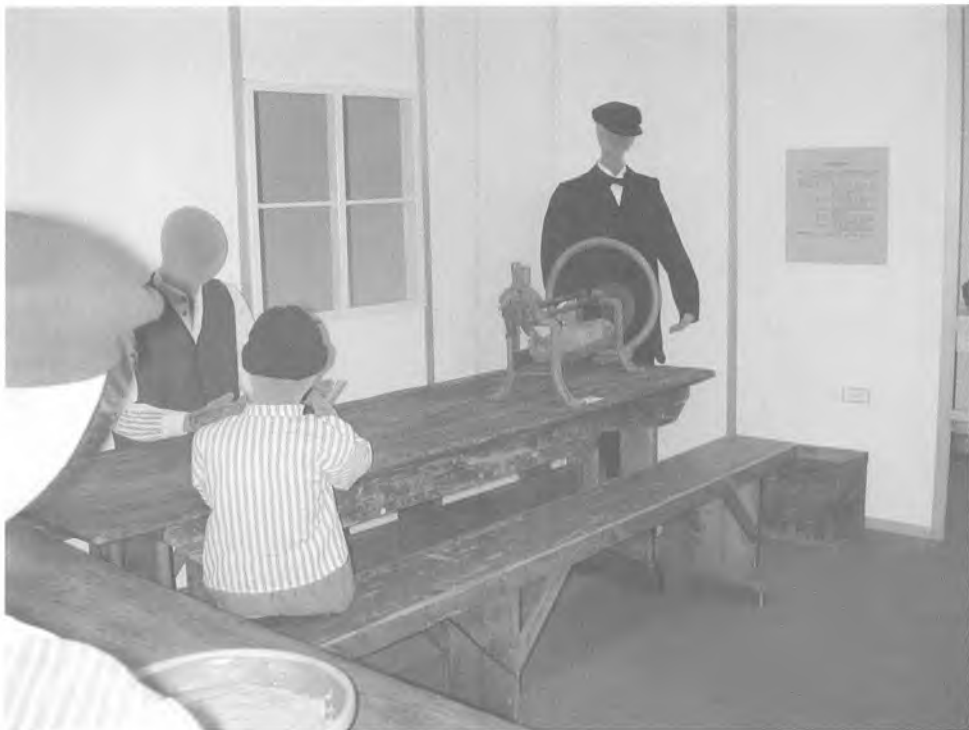
Interiør fra udstillingen «Fattiggårde på landet i Sønderjylland», Haderslev Museum 2003.

at der var rigeligt efter reglementet. Alle lemmerne erklærede, at de hver for sig normalt fik ligeså meget og af samme gode beskaffenhed, dog mente nogle, at de stundom kunne spise mere. Men det blev afgjort, at klagerne var fuldstændig ubegrundede, og dersom lemmerne en anden gang klagede uden grund, ville de udsætte sig for straf. Der var aldrig mere klager over maden i fattiggården!