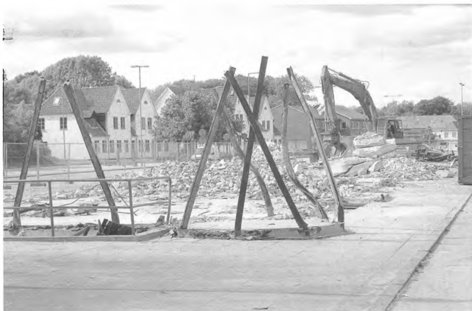
De sørgelige rester af den danske grænsebygning fra 1956 i Kruså. Foto: Karin Riggelsen. Der Nord-schleswiger.

At ideen er dødfødt skyldes bl.a. det faktum, at ordene ikke udtales ens i de