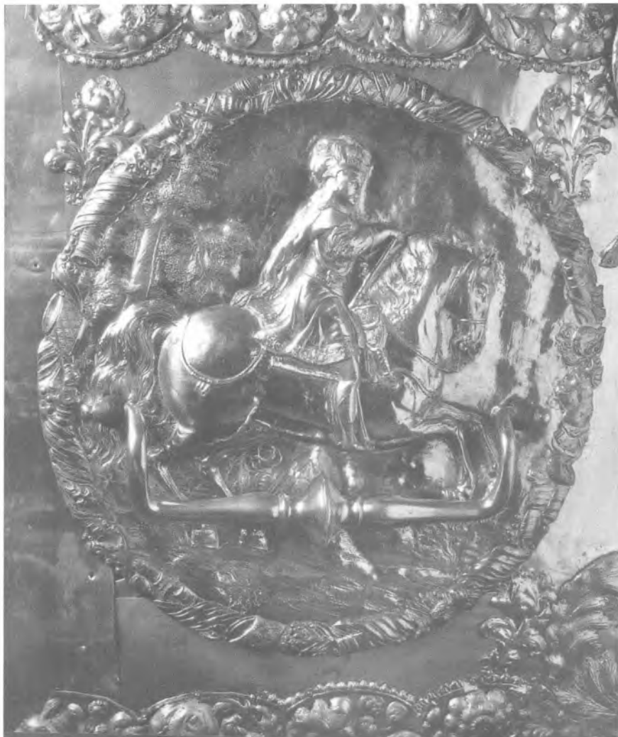
Hovedenden af Carl von Arenstorffs sarkofag. I medaljonen ses generalen til hest.

ske konge. Carl von Arenstorff blev nu kommandør i hertugdømmerne. Den daværende hertug Christian Albrecht blev i Rendsborg tvunget til at give afkald på selvstændigheden, aflevere sine fæstninger, deriblandt Tønning, og soldaterne. Men hertugen flygtede senere til Hamburg og dannede der en eksilregering,