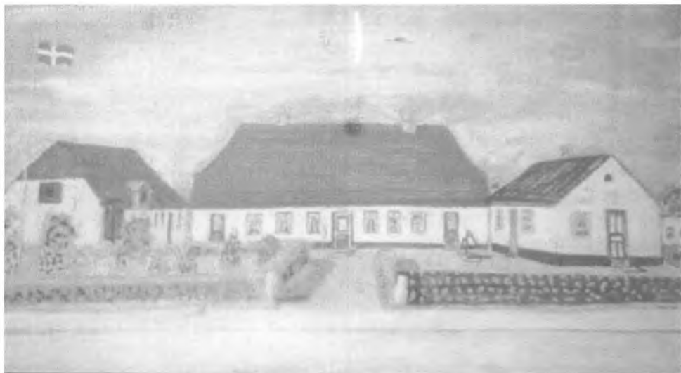
Fattiggården i Felsted, malet omkring 1930. Fotografier efter maleri.

Mange sogne fulgte i disse år opfordringen i Fattigvæsenanordningen for Hertugdømmerne Slesvig og Holsten af 1841 til at indrette fattig- og arbejdshuse for at afhjælpe den tiltagende fattigdom. I løbet af 1800-tallet blev der oprettet 63 fordelt over hele Sønderjylland. Man ønskede at begrænse det offentlige sociale