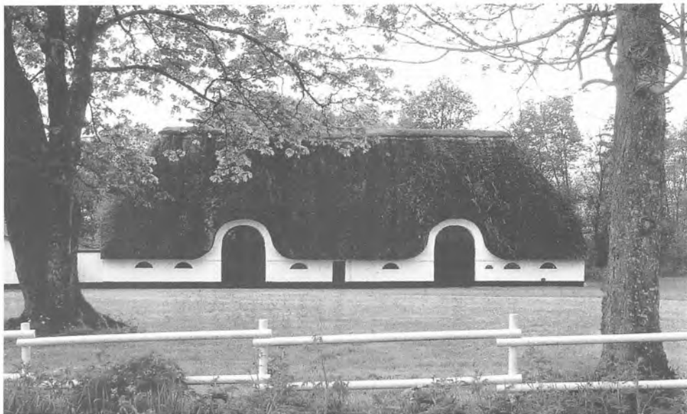
Grøngaards store lade fra omkring 1750, som skal renoveres med midler fra Kulturarvsstyrelsen og fra A. P. Møller og Hustru Chastine McKinney Møllers Fond til Almene Formål.