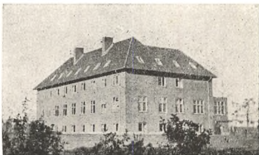
Hindholm Højskole (Barnets Højskole)