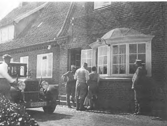
Den danske grænsestation ved Sæd i 1931.

landet, mens den resterende halvdel blev ansat i korpset uden tidligere at have været ansat i politiets tjeneste.