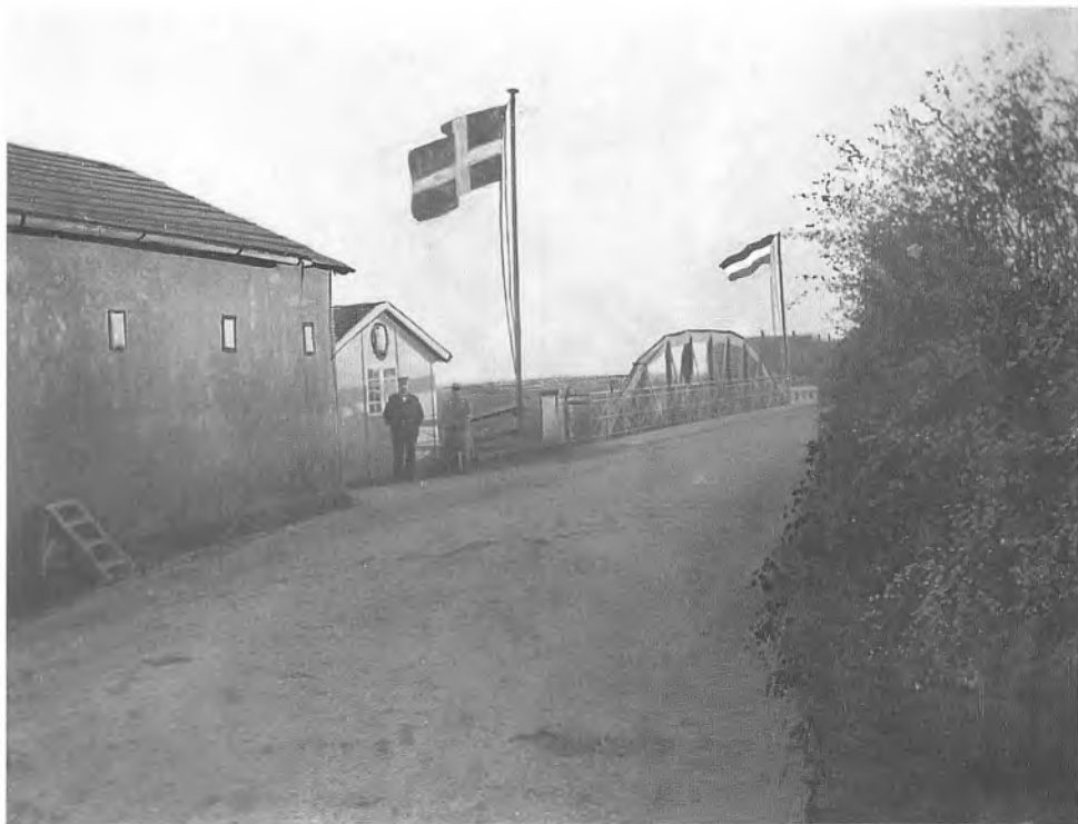
Grænseovergangen ved Møllehus med den lille træbygning fotograferet lige efter Genforeningen. For at understrege, at broen skilte mellem Danmark og Tyskland, har fotografen efterfølgende tegnet henholdsvis et dansk og et tysk flag på hver sin side af broen.

og undertegnede. Det var faktisk ret hyggeligt at spise der, idet der kom mange mennesker.