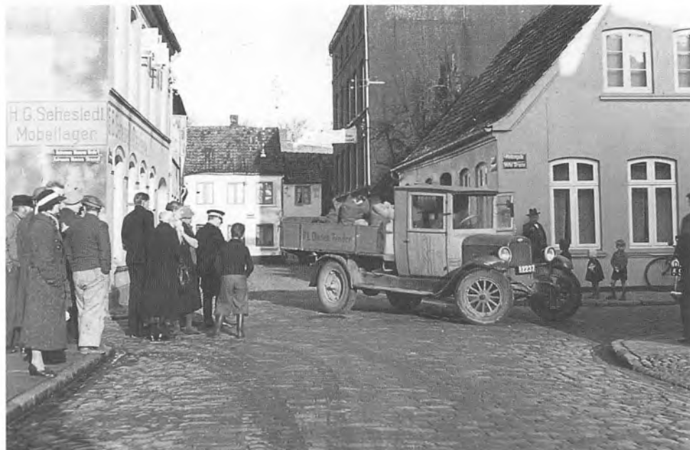
Politiet i aktion i Tønder ved et færdselsuheld. På husgavlene kan man se de dobbelte gadeskilte på henholdsvis dansk og tysk, som Hagstrup skulle vænne sig til, da han kom til Tønder i 1932.

kom ret ofte over til os, og vi kunne virkelig få en hyggelig sludder sammen. De fleste af de tyske tjenestemænd var folk i 50-års alderen. Det skulle senere vise sig, at de absolut ikke var nazister.