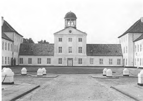
Med dronning Ingrid's død den 7. november 2000 er Gråsten Slots fremtid blev aktuel.

dommer og politimester. Men nu blev det besluttet, at det hvide slot igen skulle være sommerbolig, nemlig for det nygifte kronprinsepar Ingrid og Frederik. Dermed manifesteredes en tradition, som gik bagud til den såkaldte genforeningsproces, under hvilken kong Christian X og dronning Alexandrine hver eneste sommer gæstede Sønderjylland.