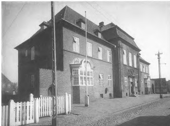
Den gamle politistation i Tønder fotograferet ca. 1935.