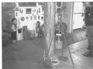
Interiør fra Sonderjysk Spejdermuseum i Aabenraa som tidligere spejderfører har ophygget. Her findes enkelte effekter fra OR's hjem og en del billedmateriale fra Gråstenspejderne.

og smuk. Lad mig blot nævne årbøgerne »Fra det gamle Løjt«, »Skrift for Historisk Forening for Sundeved« og årsskriftet fra Historisk Forening for Graasten By og Egn. Her får man hurtigt et overblik over bladets indhold, gennem indholdsfortegnelsen og med overskrifter, der meget kort gør læseren opmærksom på, hvor artiklerne starter og slutter. Dette og en letlæst skriftstørrelse gør læsningen til en behagelig oplevelse. Desværre er dette endnu ikke tilfældet alle steder. Det er beklageligt, da det ikke koster en eneste krone at komme læseren i møde på disse punkter uanset bladets omfang og trykform. Indholdet af bladene er også det vel-