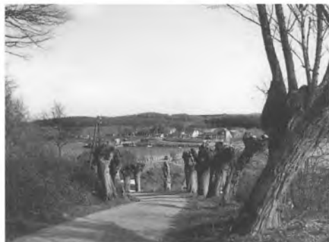
Et stemningsfuldt billede fra vejen ned mod dæmningen en gang i 1960'erne. I forgrunden ses de karakteristiske stynede træer.

Den gamle bro blev fjernet i løbet af juni måned, men der måtte anvendes betydeligt mere fyld end beregnet ved opførelsen af dæmningen. Eksempelvis blev der i løbet af en uge anvendt 1.000 m 3 på ø-siden, men på én eneste nat forsvandt det hele, og det løse mudder på begge sider skød i vejret,