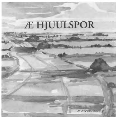
»Æ Hjuulspor« fra Lokalhistorisk Arkiv i Bredebro er årets nye markante bud på en lokalhistorisk årbog.

Selv om det indebærer risikoen for at ende som en vrissen jeronimus, der evigt beklager ungdommens fortrædeligheder, er jeg desværre også i år nødsaget til at beklage den helt manglende interesse for vores ældre lokalhistorie. Der er stort set ikke stof hentet fra tiden før det nationale opbrud i 1830. Faktisk det mindste gennem de sidste ti år. Der er lidt fra 1800-tallet, Treårskrigen og århundredets sidste årtier, og først fra tiden efter 1900 er der en tæt artikelmæssig dækning. Og med de mange meget nye erindringer fra tiden efter 1940 er tyngden rent tidsmæssigt i årbøgerne ved at forskyde sig til tiden efter 1945. Selv om begrebet »samtidshistorie« er en selvmodsigelse, så er årbøgerne ved at udvikle sig til ren samtidshistorie