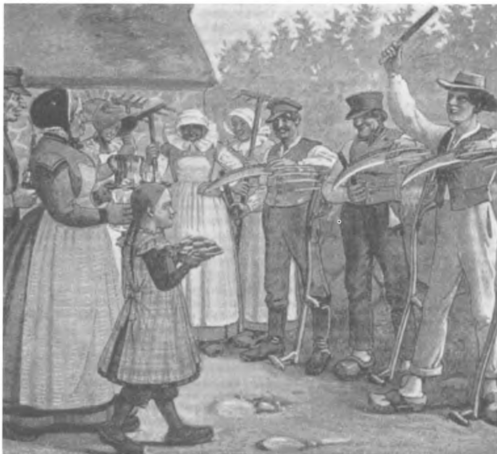
Fig. 5. Der trues med at slå for kålen.

Kort fortalt er accent 2 en karakteristisk lydmelodi i de fleste to- eller flerstavelsesord i adskillige danske dialekter. Et indledende højt toneleje følges af et lavere, der igen efterfølges af et afslut-