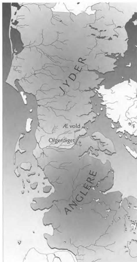
Fig. 6. I begyndelsen af det 3. århundrede blev Over Jerstal kredsen opløst af anglere og jyder, som grænsede op til hinanden ved Vidåen. År 278 bliver Olgerdiget udbygget og Æ vold opført. Her ses situationen i sidste halvdel af det 3. århundrede. Tegning: Jørgen Andersen, Haderslev Museum.

De nyeste undersøgelser af Nydammosen påviser, at der omkring vor tidsregnings begyndelse har været en kraf-