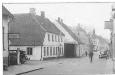
Slotsgade mod Torvet. Rejsestalden ved Den gamle Kro ragede langt ud. Den næste bygning på venstre side var Kraugs gæstegivergård på hjørnet af Nygade. Den blev revet ned og her etableredes anlægget foran det nye Gråsten Rådhus

Dengang snøede hovedvej 8 sig besværligt gennem byens snalle gader. Den eneste forbindelse - over land - fra Sønderborg og hele