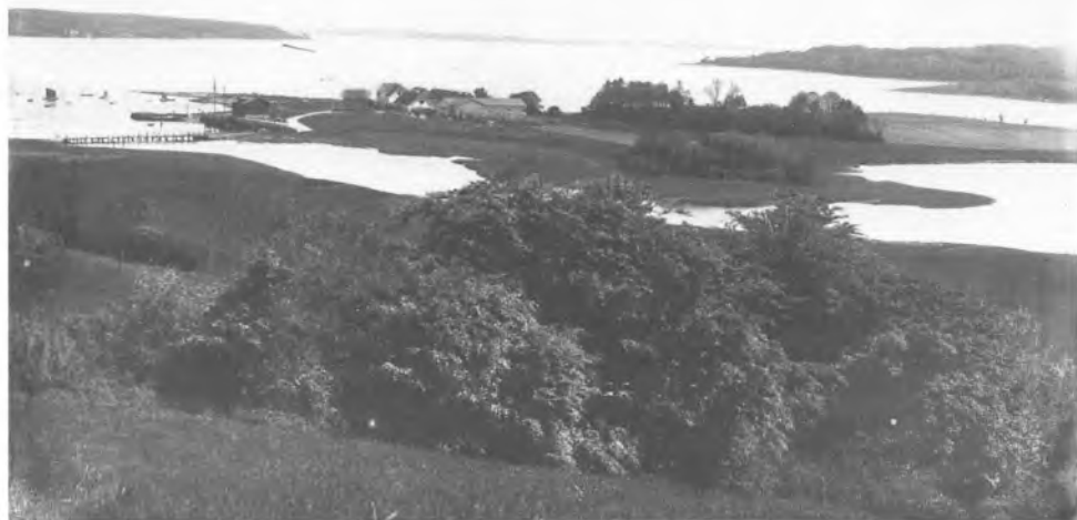
Udsigt over Kalvø engang i 1920'erne mens transport mellem fastlandet og øen stadig foregik over ageni Jørgen Bruhns dyrt bekostede træbro.

De første år efter grundlæggelsen af værftet, måtte alting sejles derover, også mandskabet, så af praktiske grunde fik han bygget en bro over til øen fra Løjt-siden. Denne bro var en stor lettelse for de mange håndværkere, der efterhånden havde fået arbejde ved skibsværftet, idet de fleste var bosiddende på Løjt Land.