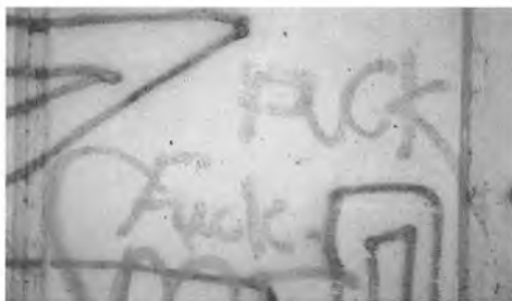
Fig. 4. Fuck, ny graffiti - gammelt østsønderjysk ord!

Der har været mange forskellige skikke, ritualer, ofringer og fester i forbindelse med ophøstningen og det sidste neg, undertiden også i forbindelse med det første neg, for slet ikke at tale om beskrevne forårsritualer med ofringer ved jordens tilberedning og såningen.