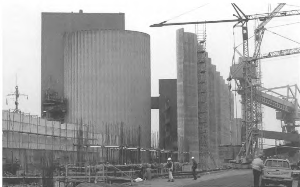
På Enstedværket er man i gang med at opføre en 25 meter høj, 20 cm bred og over en halv km lang mur, der skal værne omgivelserne mod støv og støj fra arbejdet med værkets kulbunker.