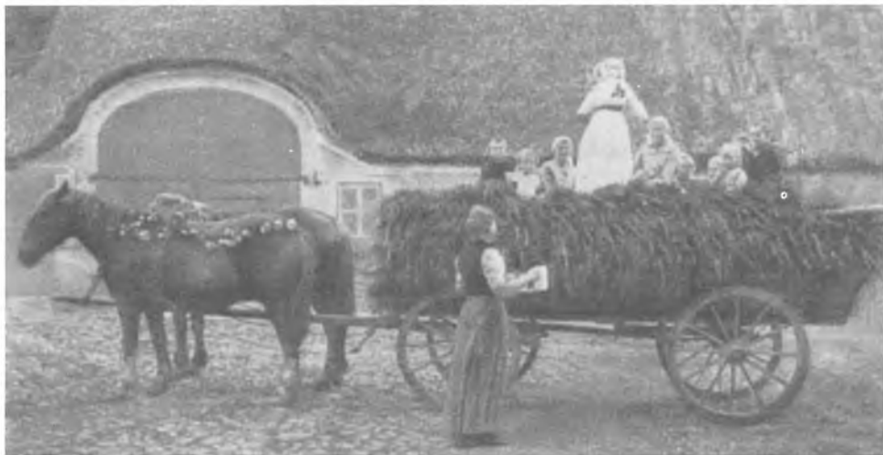
Fig. 3. Det sidste neg udklædt og pyntet som »æ fokku'en« på det sidste læs, med børn på læsset. Barsø, formentlig fra omkring 1900.

(fig.3). Så gik turen hjemad fra marken og hele landsbyen rundt, hjem til gården, idet børnene uophørligt af fuld hals råbte: »Fok, Fok, Hurrah«. Hjemme på gården kørtes en runde på gårdspladsen, hvorefter de hæse og meget trængende børn fik serveret kager og saftvand. 4)