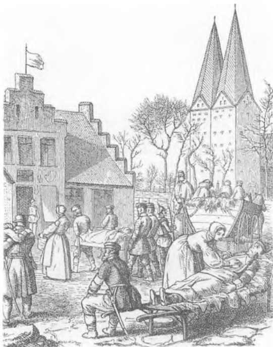
Sårede, diakonisser, medhjælpere og soldater foran krigslazaretet i Broager. Bygningen blev opført i 1864 som skole, men nåede ikke at blive taget i brug efter sit formål. I dag er huset præstegård. Illustration: Fliedner Kulturstiftung Kaiserwerth.

hængte slanger og på væggene knogler og dyreskeletter. De seks har straks med godt humør slået deres lejr op her, alt lader sig gøre«.