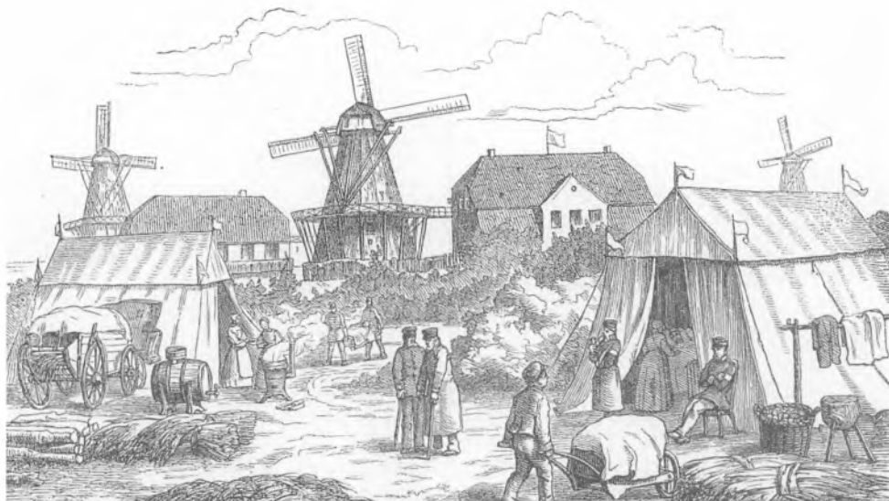
Krigslazaretterne i Sønderborg 1864 var indrettet i huse, telte og byens tre vindmøller. Illustration: Flidner Kulturstiftung Kaiserswerth.

så - i et hul. Jeg har slået alarm hos alle de herrer læger og officerer, og nu skal der skaffes kister, fire lig venter derpå.