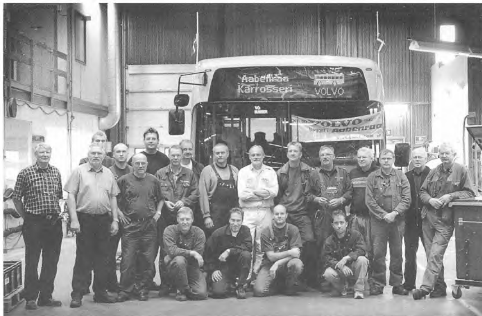
Den sidste bus forlod Aabenraa Karosserifabrik den 30. september. Produktionen flytter til Polen, og tilbage bliver kun en mindre serviceafdeling med ni ansatte. Inden lukningen har Cathrinesminde Teglværksmuseum og Institut for Sønderjysk Lokalhistorie foretaget en større dokumentation af virksomhedens historie og arbejdet på fabrikken.

mister Told og Skat. Glæden er stor i Tønder, hvor man håber, skattecentret kan rykke ind i den tomme kaserne, mens skuffelsen er udtalt i Sønderborg. »Der er lidt bytte købmand over det, men kabalens er gået op,« siger amtsborgmester Carl Holst (JV).