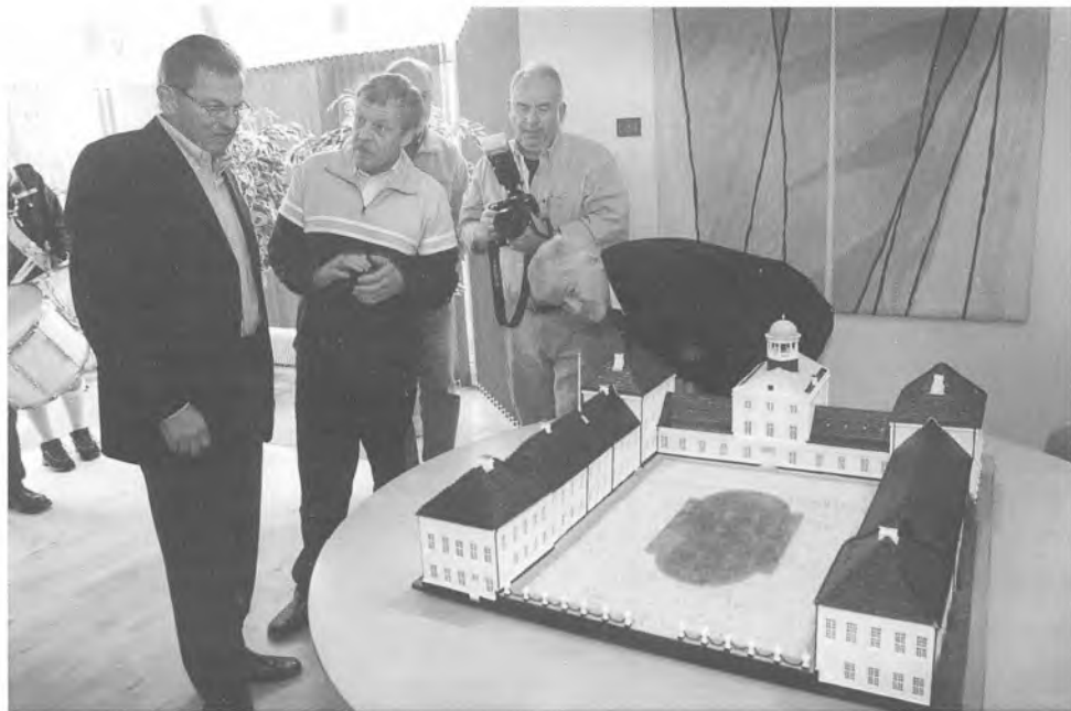
Den 22. september overrakte Haderslev skyttelav en forsinket bryllupsgave til kronpris Frederik og kronprinsesse Mary i form af en model af Gråsten Slot.

at »ministeren vælger tysk.« En af Venstres ministre siger hertil: »Det interesserer os ikke, for i Venstre er vi tolerante« (No.).