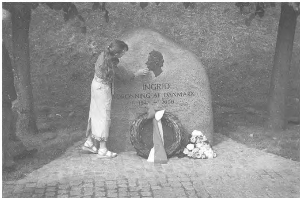
Den 25. juli afslørede Dronning Margrethe en mindesten over Dronning Ingrid i mindeanlægget på Slotsbakken i Gråsten.

slev. Gråsten kæmper fortsat for sin eksistens som en selvstændig miniputkommune, mens Rødding går mod nord til Vejen, og Christiansfeld bliver en del af den kommende Kolding kommune. Her er der dog intern uenighed, idet i hvert fald en del af beboerne i Fjelstrup hellere vil til Haderslev. Men det kræver en deling af kommunen, og på det punkt synes indenrigsministeren ikke at ville give køb, selv om det flertal i kommunalbestyrelsen, der ønsker samarbejde med Kolding, er så spinkelt som vel muligt.