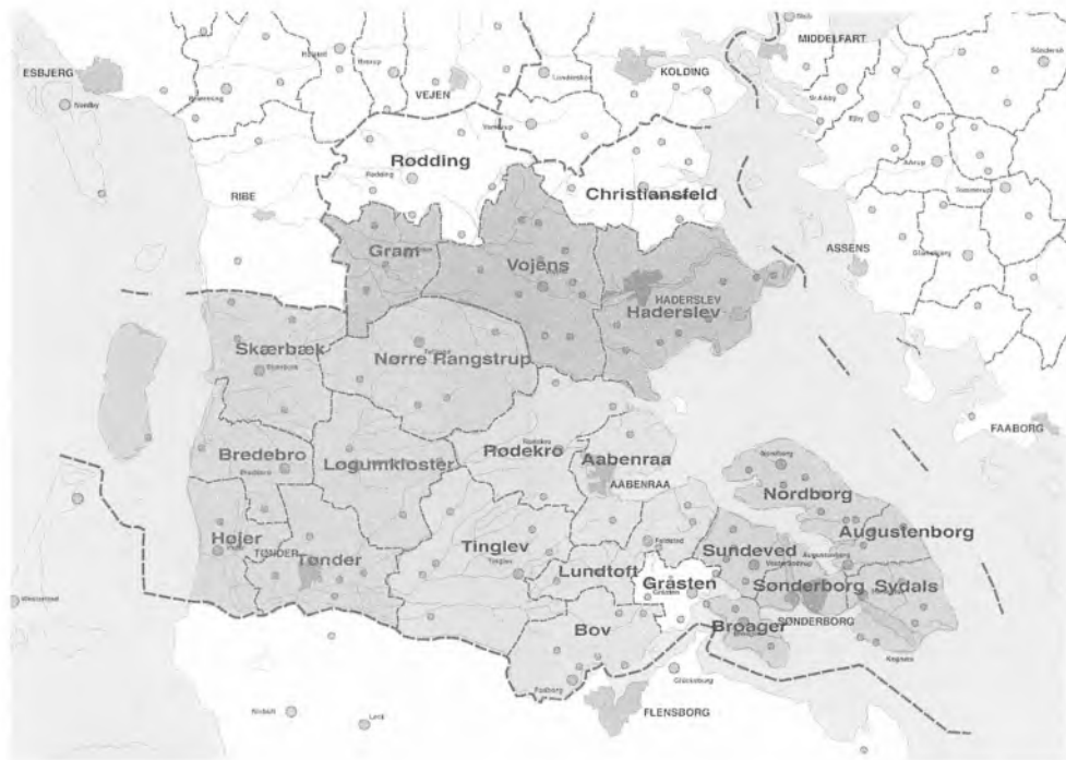
Billedet af de fremtidige kommunegrænser i det nuværende Sønderjyllands amt begynder at tegne sig. På nuværende tidspunkt hersker der kun usikkerhed vedrørende Gråsten kommunes fremtid. Byrådet ønsker, at kommunen forbliver en selvstændig enhed, men forhandlingerne kan betyde, at kommunen må gå sammen med enten Sønderborg eller Aabenraa kommune. Illustration: Marc Janku. Der Nord-schleswiger.

Kabalen om de fremtidige sønderjyske kommuner synes nu at være gået op med fire store kommuner om hver sin købstad. Der er indgået aftale om en vesteregnskommune bestående af Tønder, Højer, Bredebro, Skærbæk, Løgumkloster og Nørre Rangstrup kommuner, mens kommunerne omkring Allsund (Sønderborg, Sundeved, Broager, Nordborg, Augustenborg og Sydals) går sammen. De fire landkommuner Bov, Tinglev, Lundtoft og Rødekro slutter sig til Aabenraa, mens Gram og Vojens går i fusion med Hader-