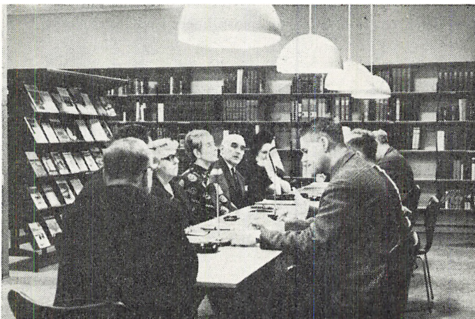
Møde på biblioteket

En vigtig del af bibliotekets service er at stille lokaler til rådighed for mødevirksomhed. Biblioteket disponerer i øjeblikket over i alt 3 studiekredslokaler med plads til 12–40 deltagere. Endvidere kan børnebiblioteket hurtigt omdannes til en mødesal med plads til ca. 100 deltagere. I tilknytning til benyttelsen af lokalerne stilles – ligeledes vederlagsfrit – moderne audiovisuelt apparatur til rådighed. P. t. disponeres over følgende apparatur: 16 mm filmapparat (og i løbet af 1969 også 2 35 mm fremvisere) dia projektor til formaterne 5×5 og 7×7, stereo-båndoptager, mobilt grammofonafspilningsanlæg, overhead projektor, sort/hvidt fjernsyn og FM-radio. Lokalerne har i de forløbne to år været meget benyttet, idet