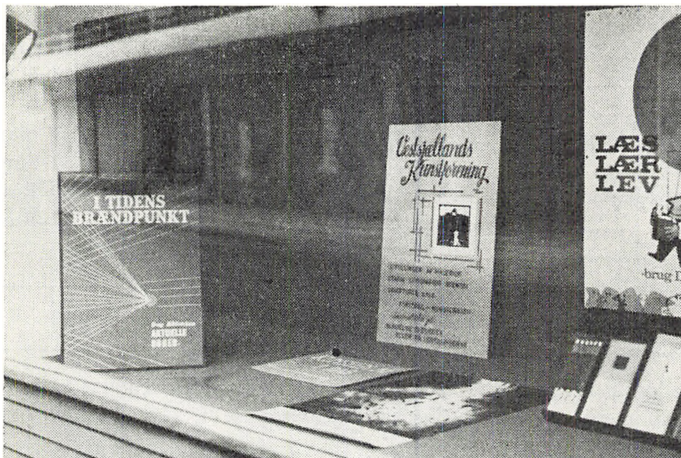
Foreningernes vindue i Bredegade

Biblioteket har i de forløbne to år haft et omfattende samarbejde med byens foreninger og oplysningsforbund og har i fællesskab med disse afholdt en række arrangementer. Fra 20. april 1967 til 31. marts 1969 har biblioteket disponeret over et par udstillingslokaler i Bredegade 11. Desværre kunne lejemålet ikke videreføres efter 1. april 1969, men i den forløbne periode har lokalerne været flittigt benyttet, især i samarbejde med Vestsjællands Kunstforening. I tilknytning til udstillingslokalet var der et vindue, foreningernes vindue, ud mod Bredegade, som har været brugt som blikfang, således at biblioteket har disponeret over den ene halvdel, og forskellige foreninger på skift over den anden.