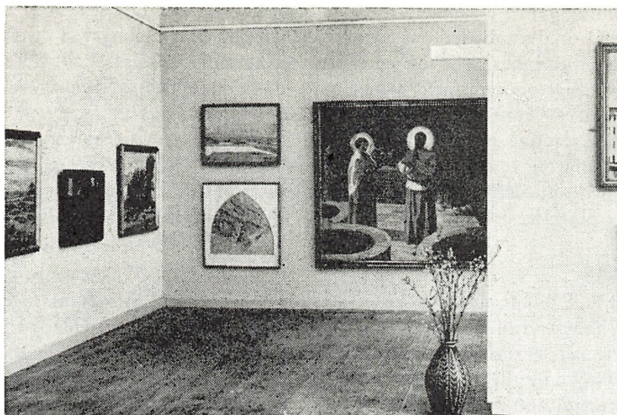
Larsen Stevns udstillingen i Bredegade

ger på centralbiblioteket kan nævnes: Gotland, Sovjet, Finland, Højskoler, Lundbye. Biblioteket disponerer nu over et moderne udstillingssystem, som med tiden vil blive suppleret, og som muliggør, at der kan afholdes ret store udstillinger i udlånslokalerne.