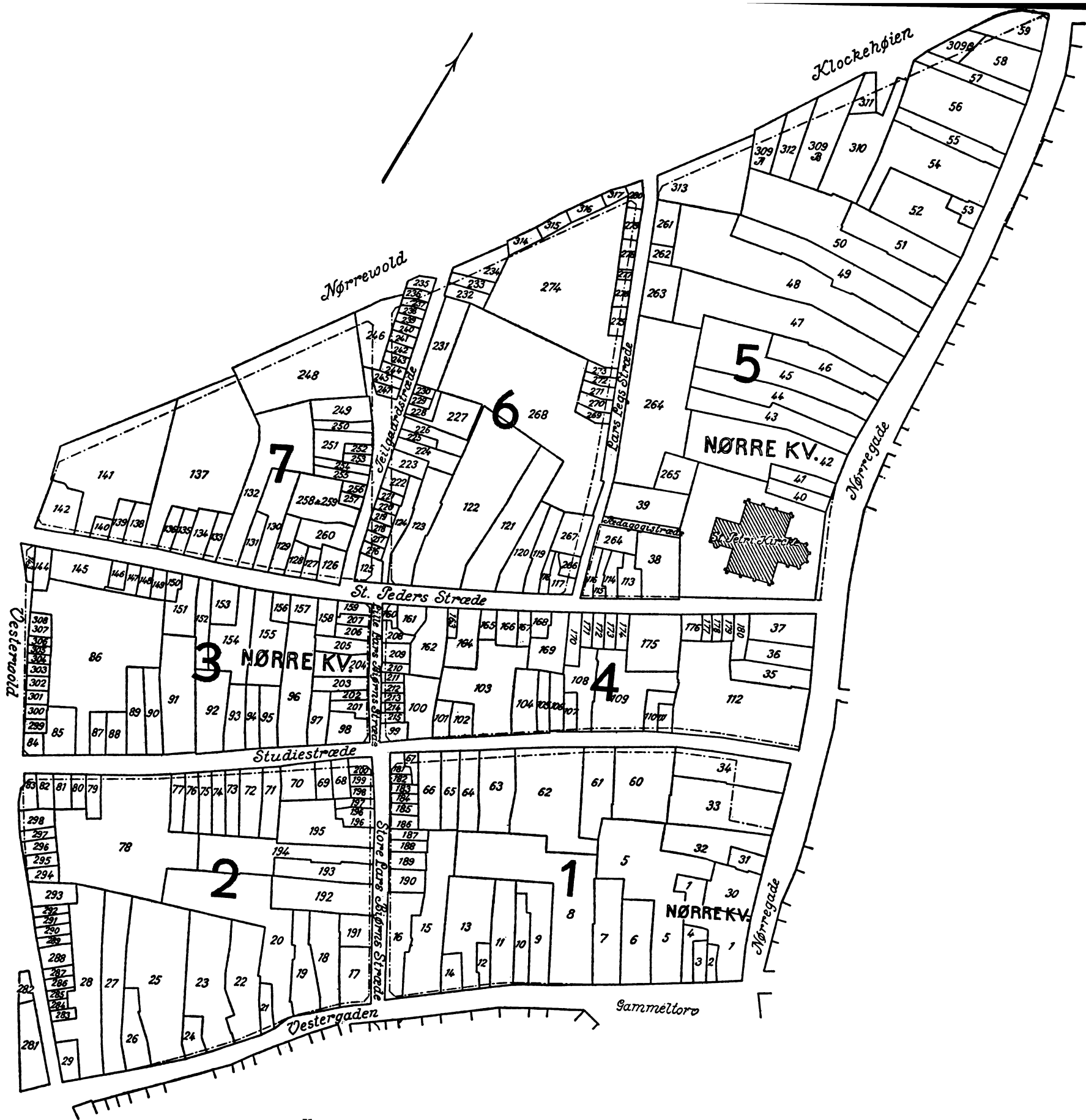
Kort over Nørre kvarter 1689 udarbejdet af H. U. Ramsing.