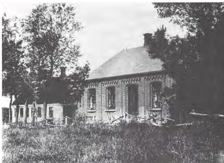
(ad 22) Gejsing skole ca. 1906. Tv. den gamle stråttækte lærerbolig med landeri og den oprindelige skolestue, og th. den nye skolebygning opført 1886, der havde 2 klasseværelser.