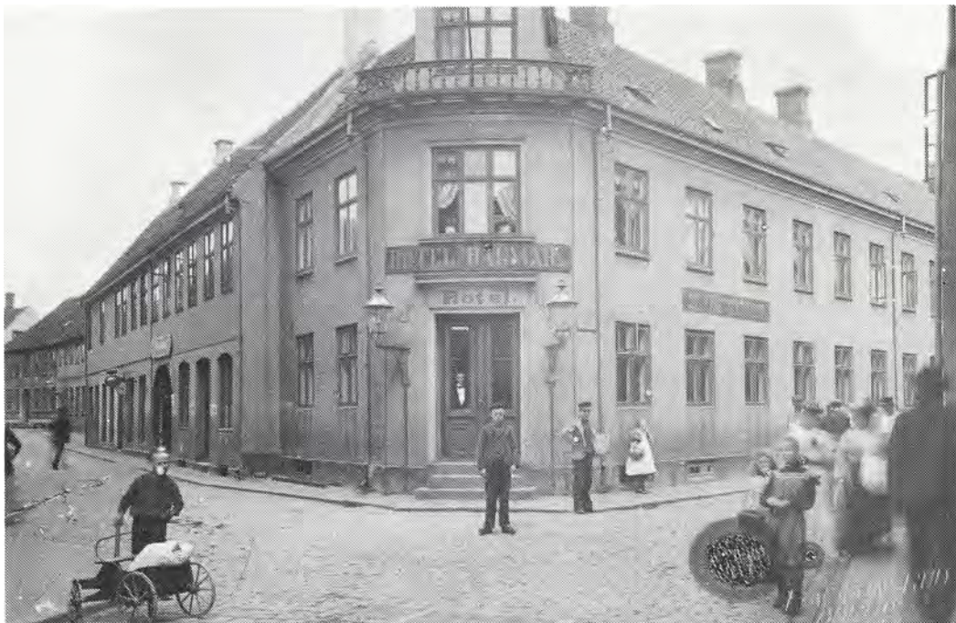
(ad 1) Hjørnet af Tangen (nuv. Klostertorv) og Guldsmedegade ca. 1898. Som det vil ses, er der blevet indrettet hotel ("Dagmar") i en del af den gamle købmandsgård. Indkørselen til selve gården kan skimtes til venstre i billedet.