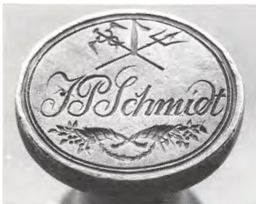
(ad 1) Fotografisk gengivelse af Jens Peter Schmidts signetplade. Symbolerne i pladens øverste felt hentyder til hans dobbeltvirksomhed som købmand og som skibsreder.