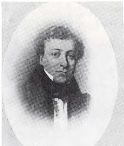
(2) Peter Fløjstrup 1801–1853