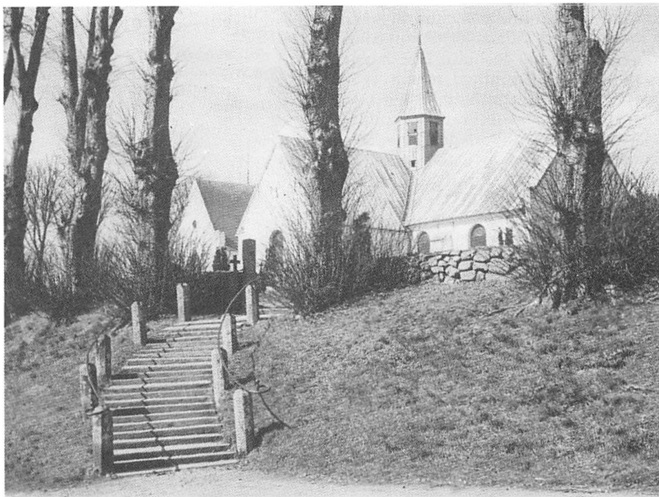
Ældre foto af Hoptrup kirke med de store, gamle træer stående rundt om kirkegården. Det var her ved kirken, den første edsaflæggelse skulle finde sted, og det var her, et Dannebrog var hængt op i træerne.

ske regering efter 1850, og officererne brugte ofte en strøm af skældsord og trusler, der ophidsede folk i stedet for at berolige. I et tilfælde henviste den pågældende officer endog tidligere danske soldater til, at de ved at nægte eden vanslægtede fra deres forfædre, som så heltemodigt havde kæmpet imod de danske.