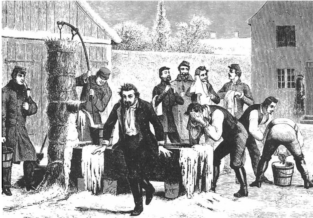
»Vore Soldaters Morgentoitte« hedder dette samtidige træsnit af Carl Bøgh fra »To Hundrede Træsnit. Tegninger fra Krigen i Danmark 1864«, tillæg til Illustreret Tidende 1862-63.