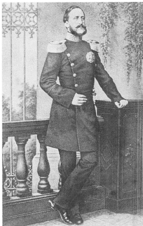
Hertug Friedrich af Augustenborg, 1829-1880.

Så snart budskabet om den danske konge, Frederik 7.'s død den 16. november 1863 nåede frem til den augustenburgske hertugslægt i Tyskland, afskrev den aldrende hertug Christian August (oprørs-hertugen fra 1848) sine rettigheder til Slesvig og Holsten til fordel for sin søn, prins Frederik, og denne lod sig udråde til hertug af Slesvig-Holsten. I en proklamation ud-