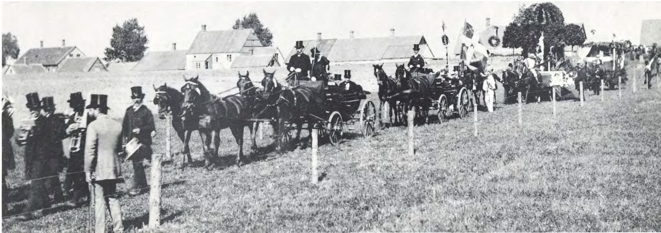
Næstveds gamle håndværkere satte under laugsvæsenet og og så senere deres præg på byen, og håndværkerfester har byen set mange af — med farverige, festlige optog. Her er håndværkeroptoget ved festen 28. juli 1889 anført af et truttende hornorkester, hvis medlemmer er i »diplomat« og høje hatte, derefter to vogne med honoratiorens og dernæst den lange række af udsmykkede vogne illustrerende hver sit håndværksfag.