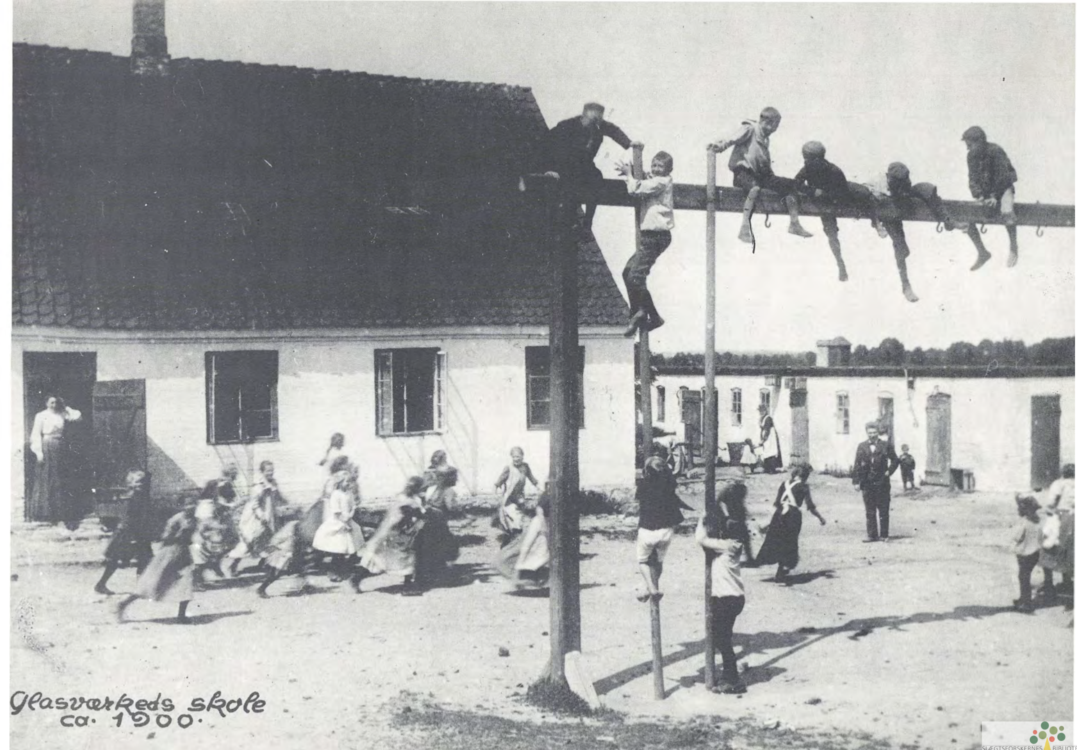
Glasværkeds skole ca. 1900.