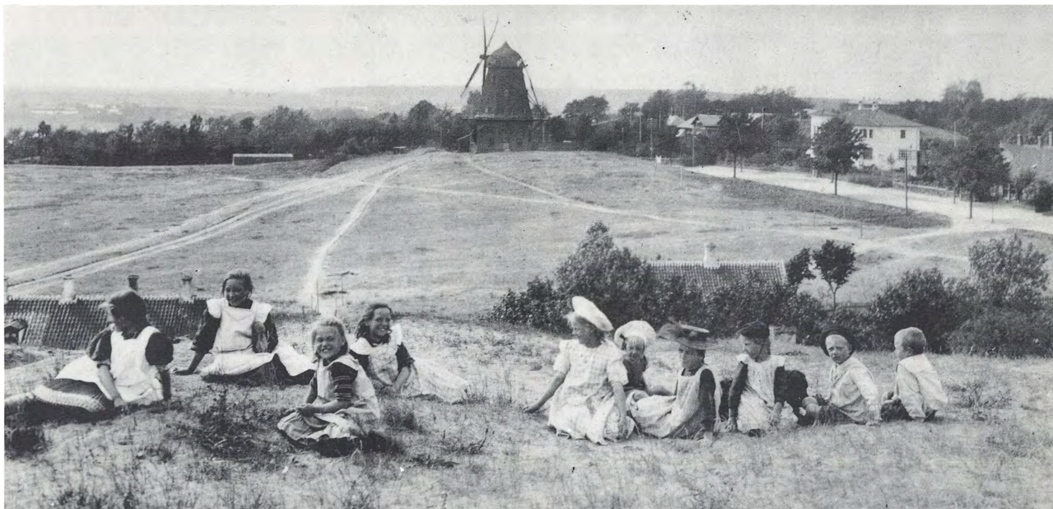
Sådan var det osse i halvfemserne — i Næstved. Et parti fra »Gallemarken« med en af Næstveds gamle møller i baggrunden. Datidens teeagere lancerer »forklædemøden«. Nu er arealet tæt bebygget.