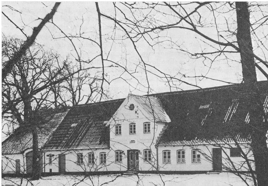
Gl. Egegård set fra gårdsiden.