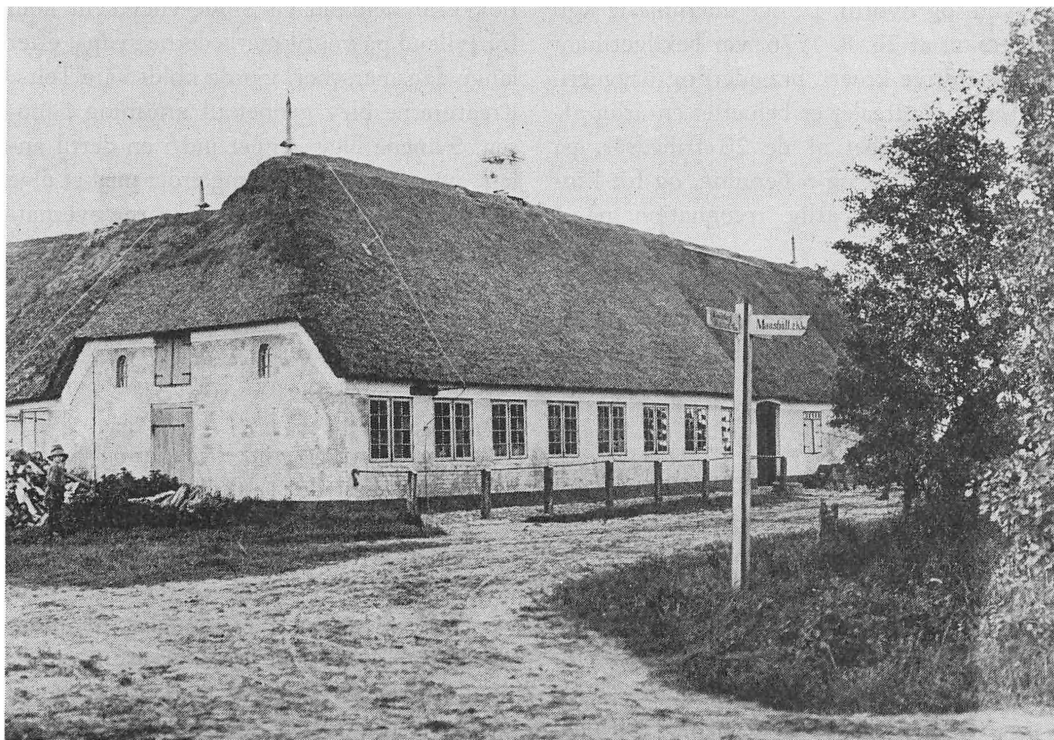
Teltkro omkring den første verdenskrig.