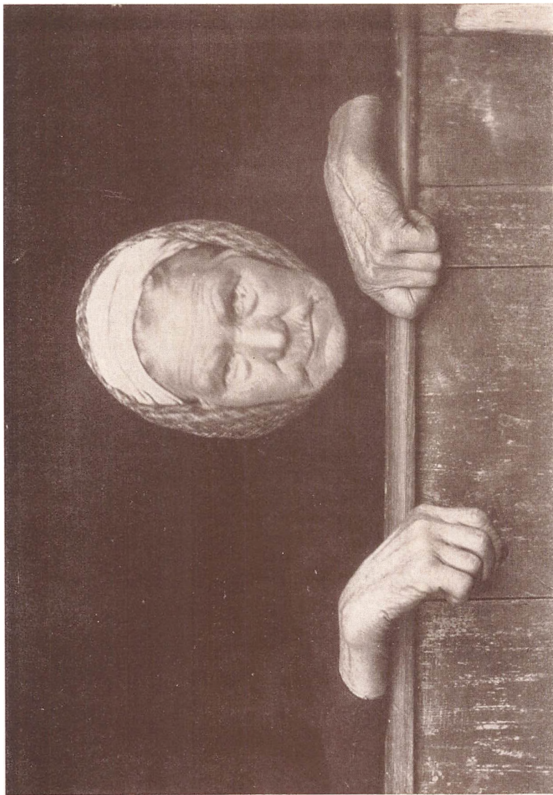
Gamle Sline fra Gallehus.