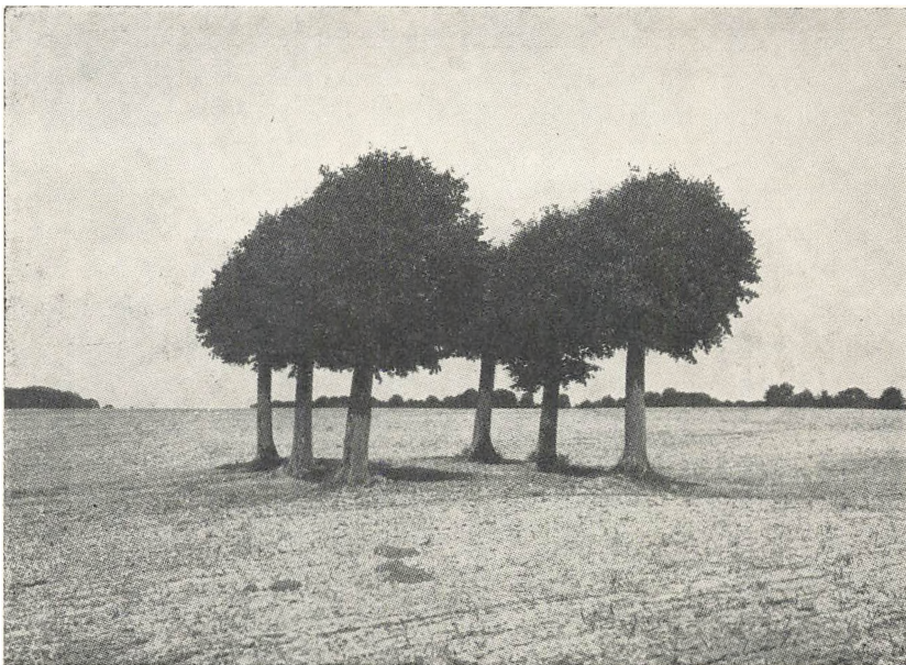
Brandtræerne, hvori Gaarden Røst's Brand er hensat.

Skrædderen satte som før Grød og Mælk over hos Nisserne i Pol-dene, men de rørte det nu ikke, da Nis jo aldrig har kunnet lide, at der blev dreven Løjer med ham.