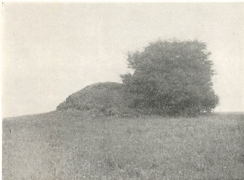
Brandtjørn og Kæmpehøj ved Højentoft, Nybøl Sogn.

Denne Folketro træffes endnu ret hyppigt overalt i Angel.