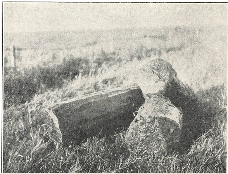
Olmersdiget: Palisadepæle fra Bredmose