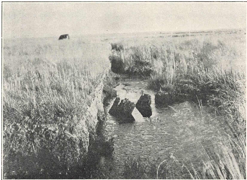
Olmersdiget: Egepæle i Bredmose