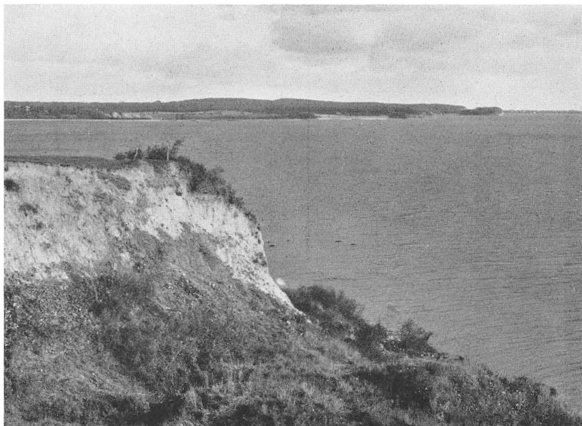
Udsigt fra Dybbøl Strand mod Sydkysten af Als.