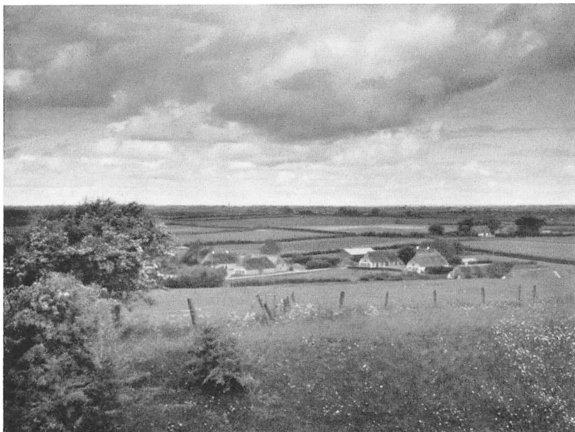
Udsigt fra Skanse IX mod Dybbølesten og Forterrænet.