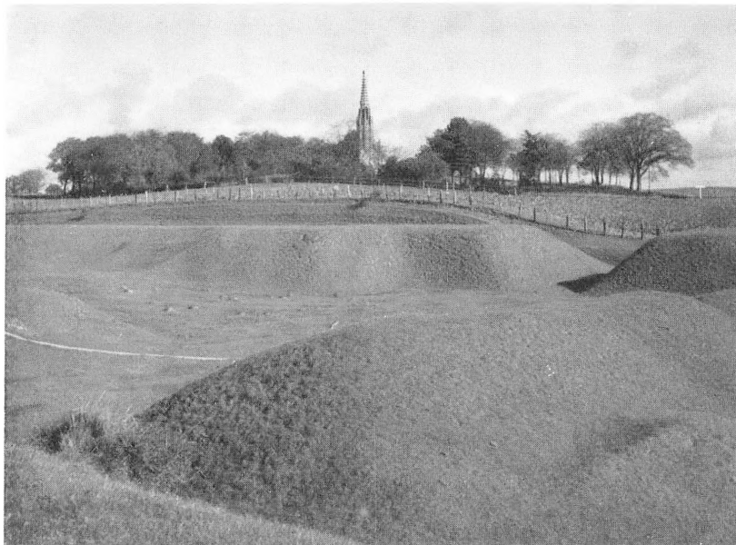
Udsigt over Skanse III med det tyske Monument i Baggrunden.