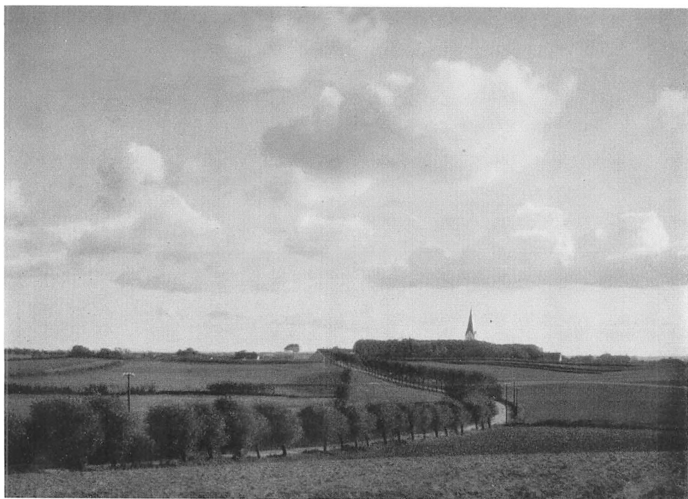
Landevejen fra Dybbøl til Broager.