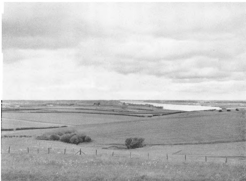
Udsigt fra Kongeskansen mod Nord udover Alssund.