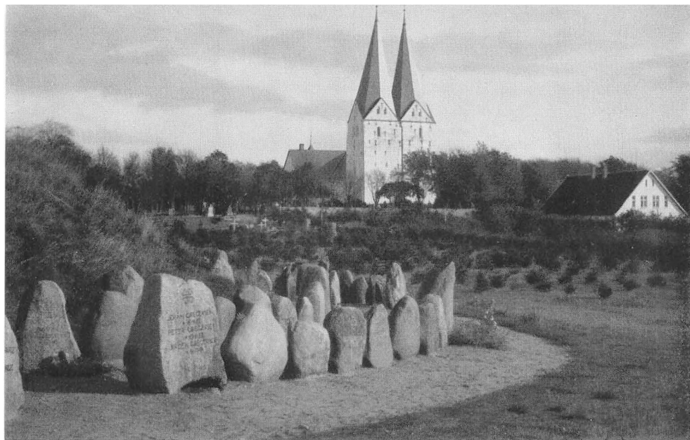
Krigergrave ved Broager Kirke.