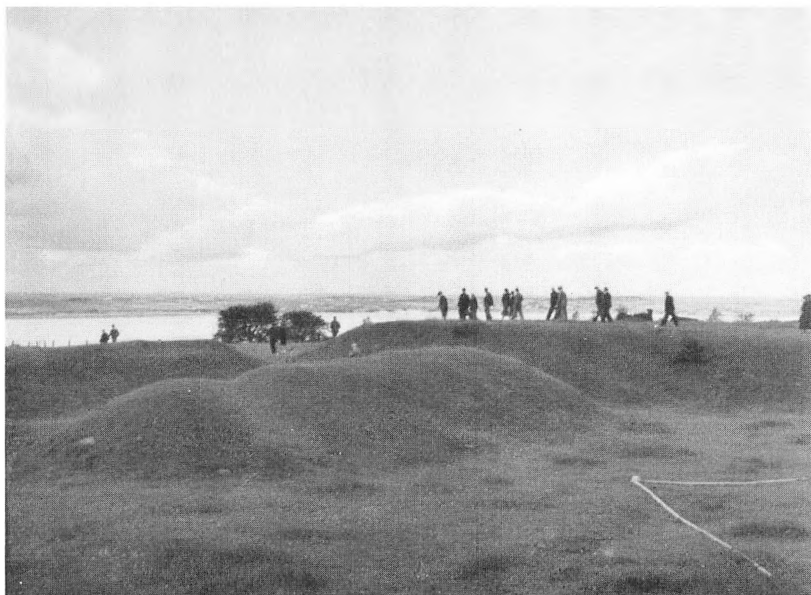
Udsigt fra Skanse III mod Broagerland.