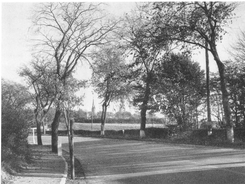
Flensborg Landevej udfor den store Krigergrav.