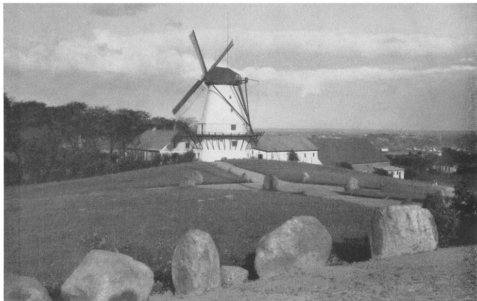
Dybbøl Mølle set fra Flagpladsen.