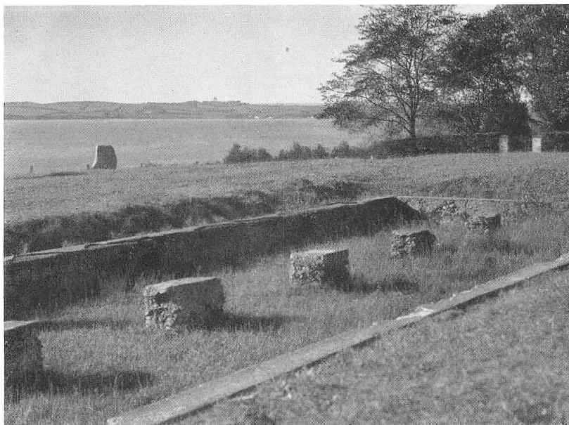
Skanse II, Blokhushfundament og Korp. Nellemanns Mindesten.