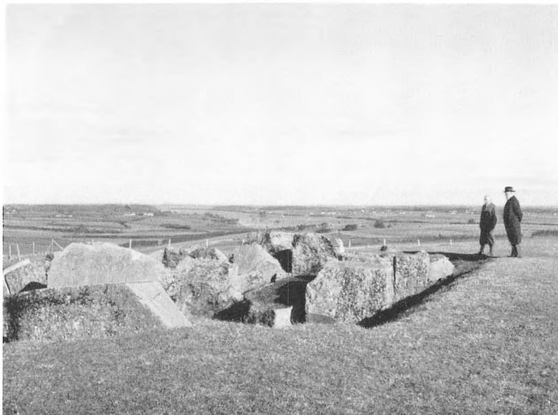
Et af de gamle Ammunitionsmagasiner i Skanse VIII.