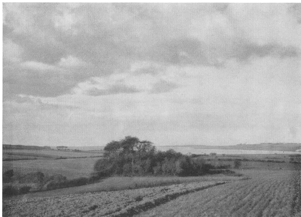
Udsigt fra Broager over Vemmingbund.