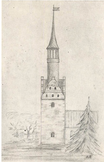
Visby Kirkes oprindelige Taarn. (Efter Arbejdstegning).