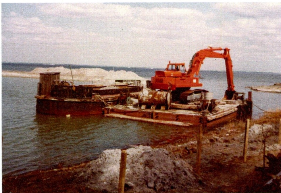
Store mængder sand blev flyttet inden havnen stod klar

Første spadestik blev taget 8. november 1985. Vejrgudernes historisk ublide opførsel i 1940ernes tre iskolde "krigsvintre" i træk blev præcist gentaget i 1980ernes tre "havneanlægsvintre"! Det blev til meget barske byggeperioder. Nivå Havn er i bidende kulde og frost bogstaveligt talt skåret og hugget ud i sne og 28 cm fast is. Men uanset de voldsomme minusgrader overnattede entreprenørens "havnebisser" alligevel lejlighedsvist i telte, som var placeret øst for Svanesøens klitter i læ for kraftige nordvestenvinde.