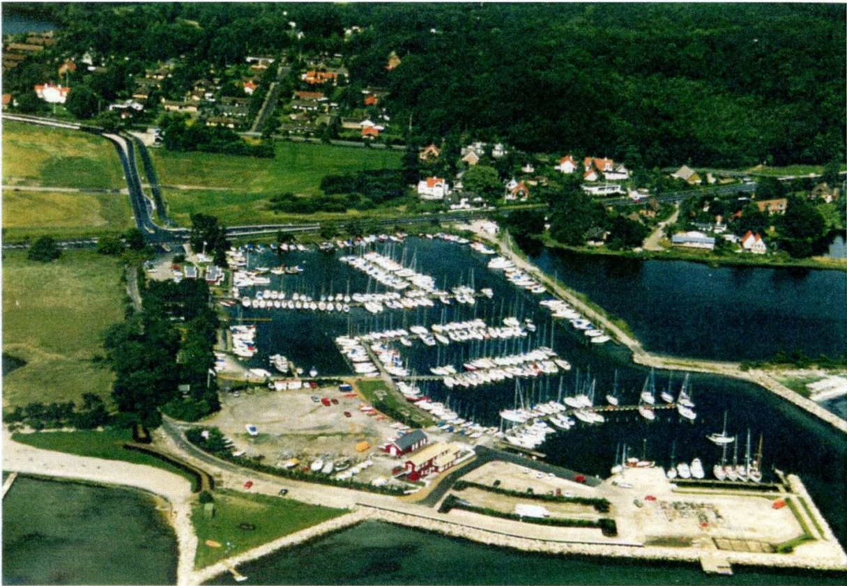
Den nye havn set fra luften