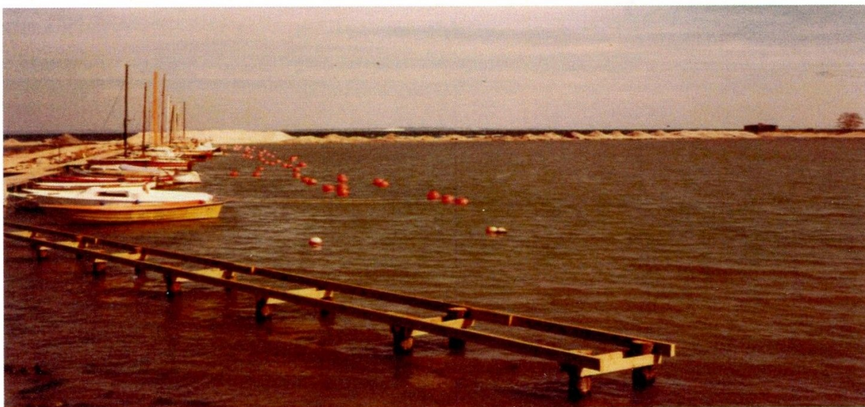
Den gamle havn med strandtangen i baggrunden

Karlebo Kommune havde undervejs i planlægningsforløbet fået anlægstilladelse af Frederiksborg Amt, idet indvinding af ler fra denne grav, benævnt Søgraven, ikke mere ville kunne lade sig gøre. Ministeriet for Offentlige Arbejder bestemte herudover, at havneanlægget kun må anvendes som lystbådehavn. Bådebro A er registreret som Første Anlægsetape (1984).