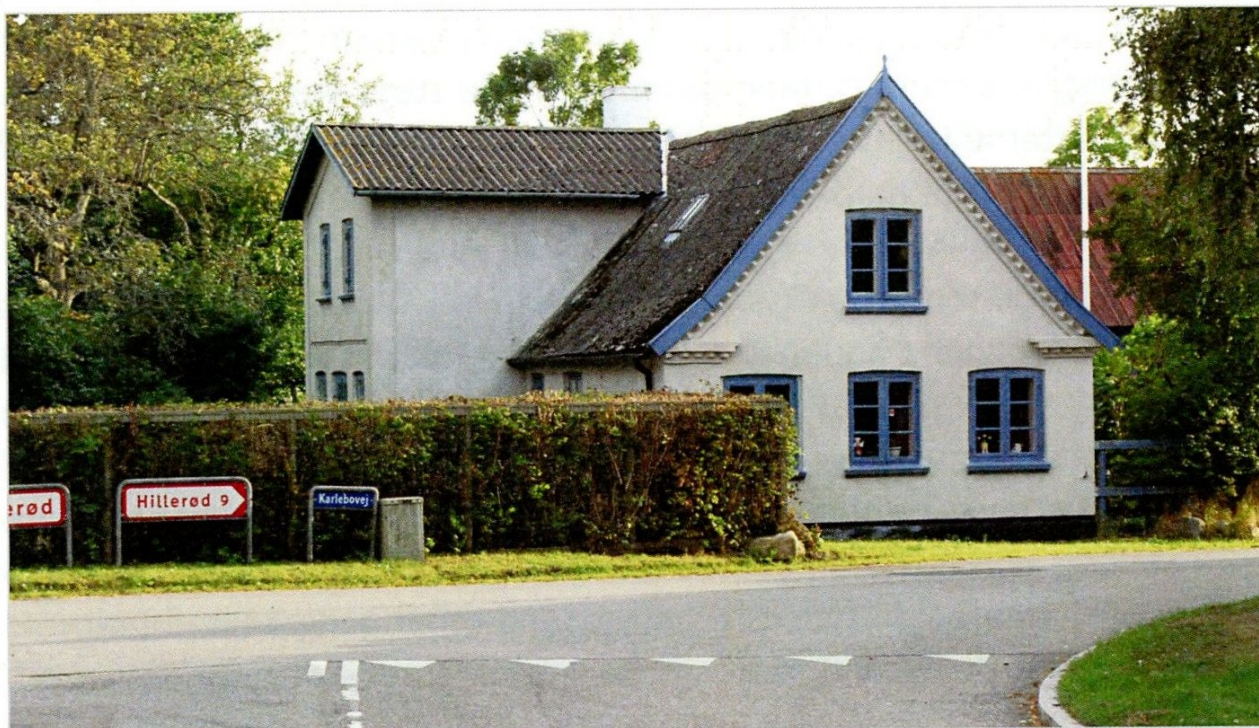
Karlebo gl. Købmandshandel