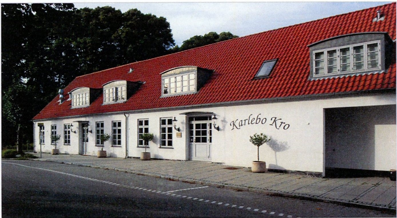
Karlebo Kro anno 2013

Jeg tvivler ikke om, at det faktum, at Karlebo Skole stadigvæk eksisterer og ikke blev lukket, som adskillige byrådsmedlemmer ellers havde lagt op til – og som det er sket i masser af tilfælde andre steder i landet – skyldes jeres indsats. Kroforeningen, idrætsforeningen og skolen er så at sige en treklang, der gør stærk og skaber en identitet, en ånd, en holdning, der betyder, at når I trues herude på jeres værdier, så er I klar til kamp.