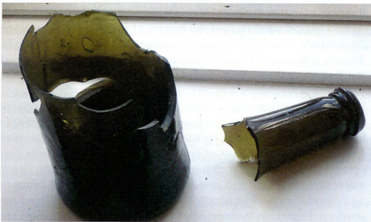
Den i teksten omtalte flaske.

At bl.a. fornemme gæster har besøgt den gamle Karlebo Kro, det har vi faktisk et håndgribeligt bevis for idet der blev fundet en flaske under