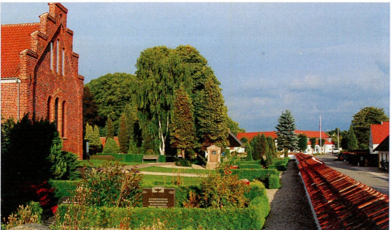
Karlebo kirke med kroen i baggrunden

Desuden steg kravene til komfort, og når man f.eks. selv kunne medbringe al maden til en fest i forsamlingshuset samt diverse hjælpere, blev det overkommeligt for de fleste at afholde familiefesterne der. Derfor blev bygningen af Karlebo Forsamlingshus i 1923-24 af meget stor betydning for sognets sociale liv.