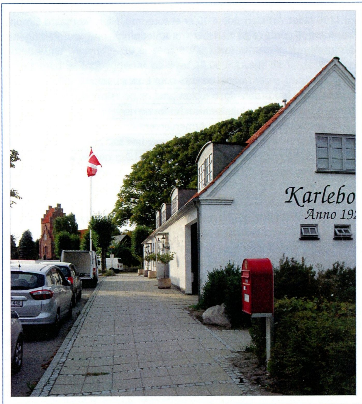
Karlebo Kro anno 2013.