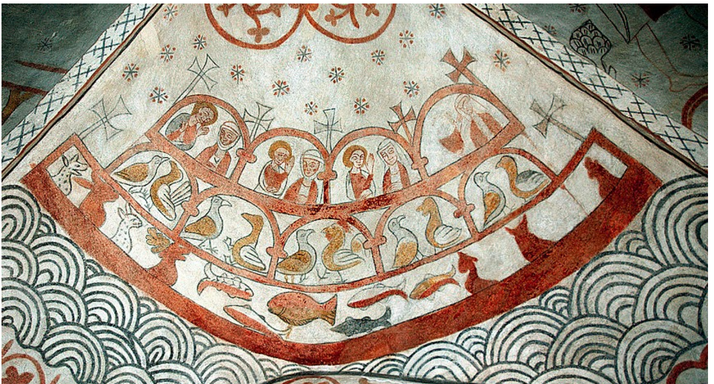
Noahs ark på kalkmaleri fra o. 1325 i Kirkerup Kirke.

Ved visitatserne skulle biskoppen undersøge præstens embeds- og livsførelse, om embedsbøgerne var ført korrekt og kirkens og kirkegårdens stand. Men helt centralt var hans overværelse af overhøring af menigheden, især ungdommen, i dens kristentro.