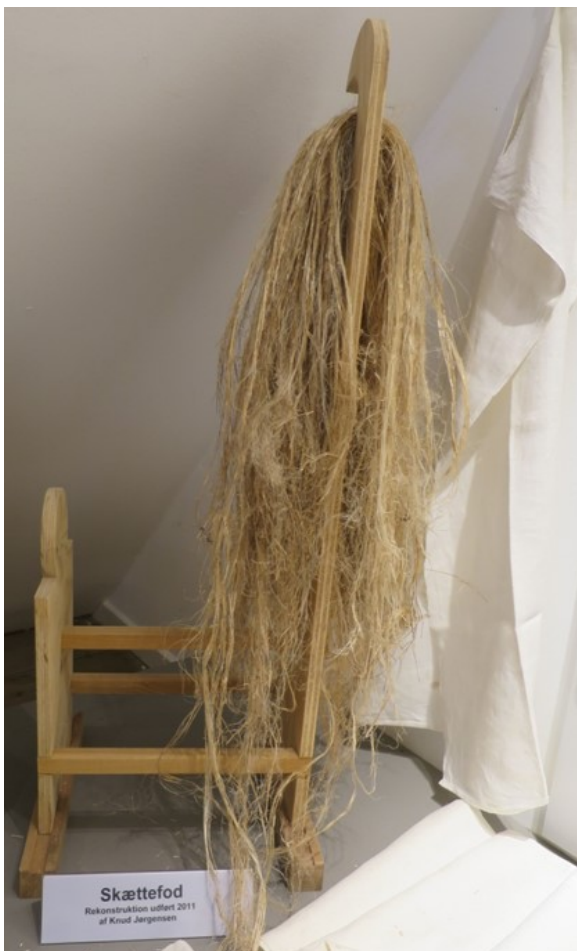
Rekonstruktion af skættefod