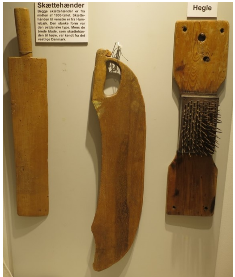
Redskaber til hørfremstilling