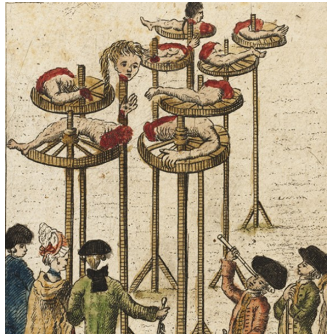
Udsnit af tegning af greverne Struensee og Brandt lagt på hjul og stejle i 1772.

dem, der ikke optugter deres børn på en anden måde. Det kan vi se dagligt, hvis vi ellers lægger mærke til det.