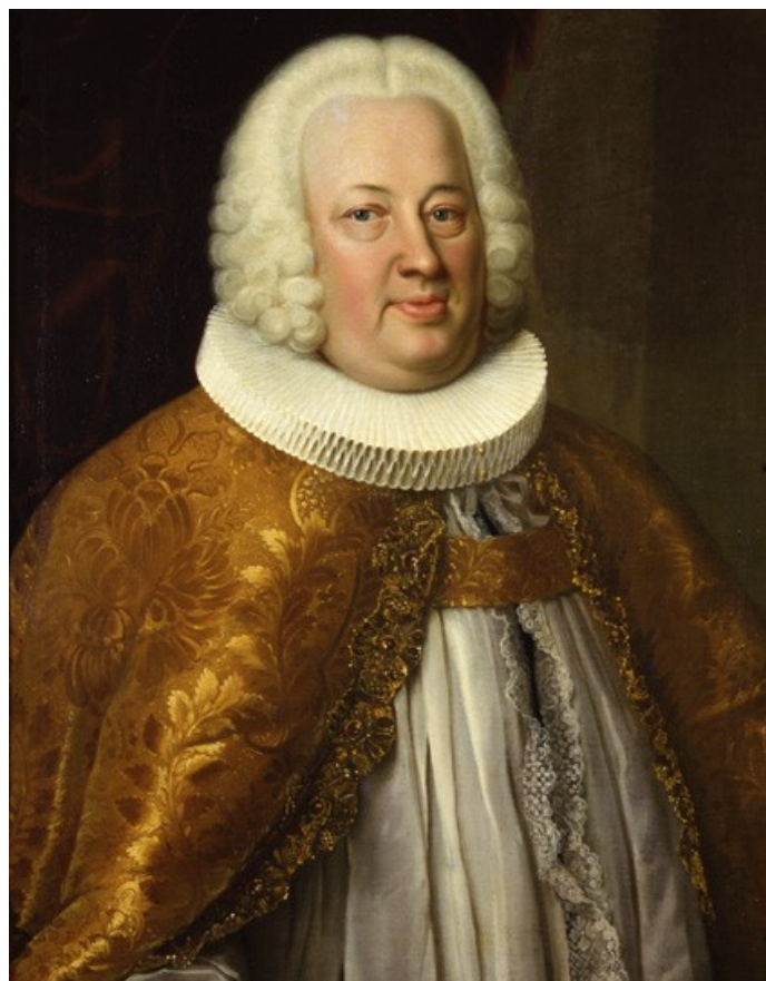
Biskop Peder Hersleb i fuldt ornat

Ungdommen klarede sig dårligt, og det tillægger han skoleholder, degn og kapellan ansvaret for, men som det vil fremgå af en følgende artikel her i 'Rytterskolen', gik det senere meget bedre.