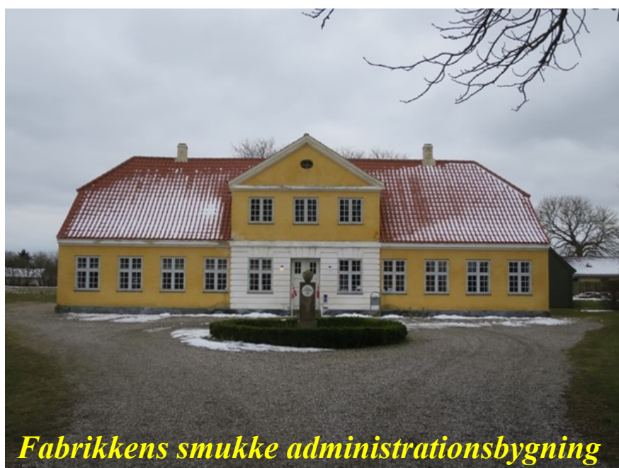
Fabrikkens smukke administrationsbygning