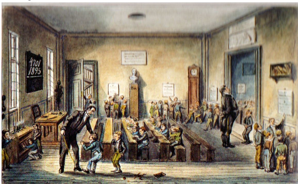
Indbyrdes undervisning i en københavnsk skole.

”Læse for biskoppen”. Dansk Folkemindesamling. Folkeliv 3-93, 1906/46.