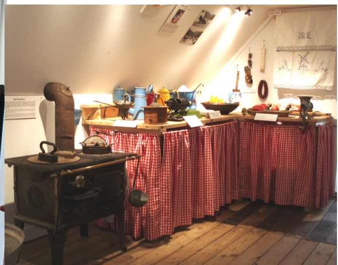
Fra museets særudstilling.