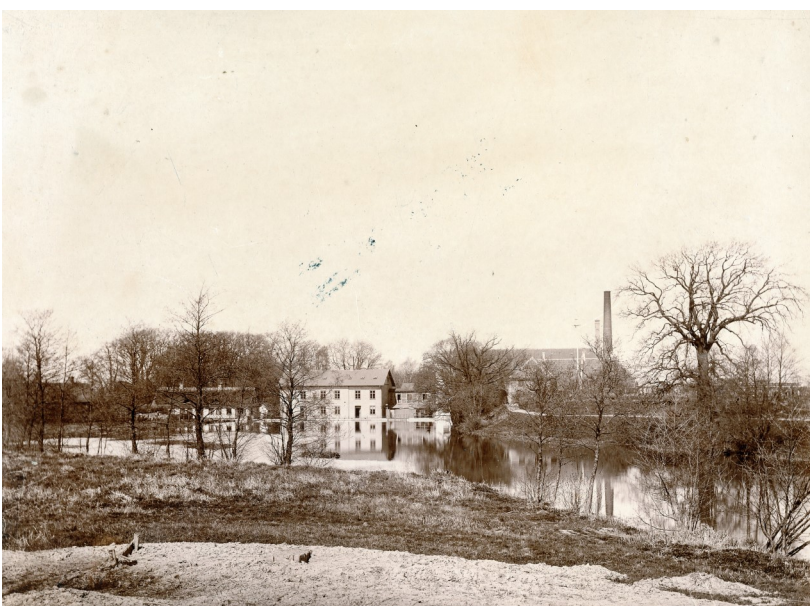
Den militære Klædefabrik i Usserød ca. 1890, set fra Kongevejen.

Mødested: Fredensborg Museum, Avderødvej 19, Avderød. Deltagelsen er gratis. Alle er velkomne.