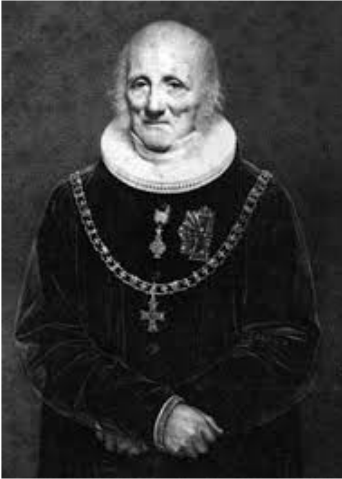
Biskop Jakob Peter Mynster