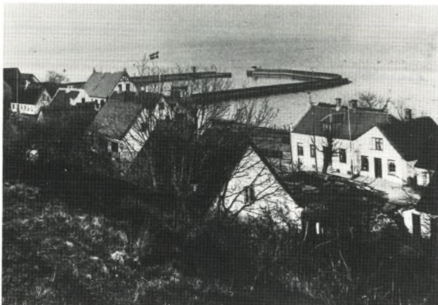
Høkerhuset set fra Solbakken ca. 1908.