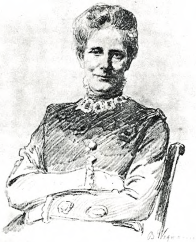
Bertha Wegmanns tegning af Emma Gad. Frederiksborg museet.