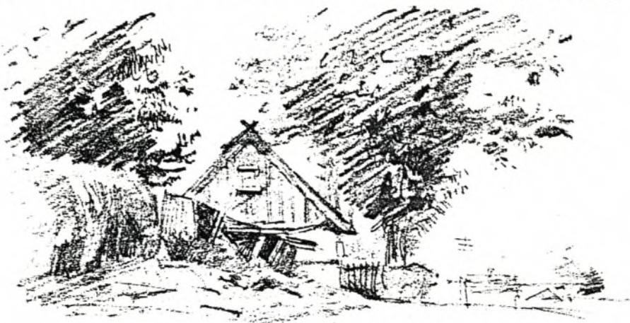
Huset Gl. Strandvej 32, tegnet i 1883 af Tom Petersen. Træet er væk, men huset står stort set uforandret den dag i dag. – Originaltegning i Nationalmuseets 2. afd.

Næst i denne Anledning at oplyse, at Andrageren ifølge Contract af 28 Juli 1852. fra 1 Januar Maaned at regne blev ansat som Brevsamler i Humlebæk, med Forpligtelse til dag-