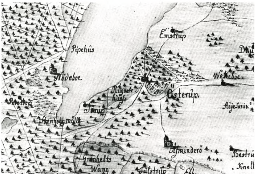
Kort fra Frederik Vs atlas