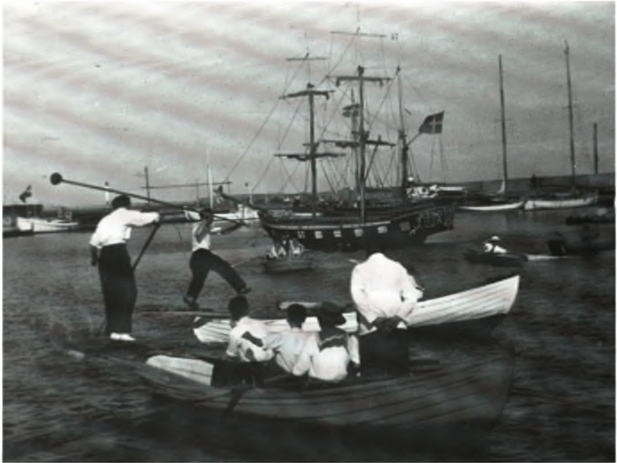
Dyst mellem to både. „Fregatten“ ses i baggrunden. 1930-erne

bak. Husene var små og børneflokkene store, og man levede fra hånden og i munden.