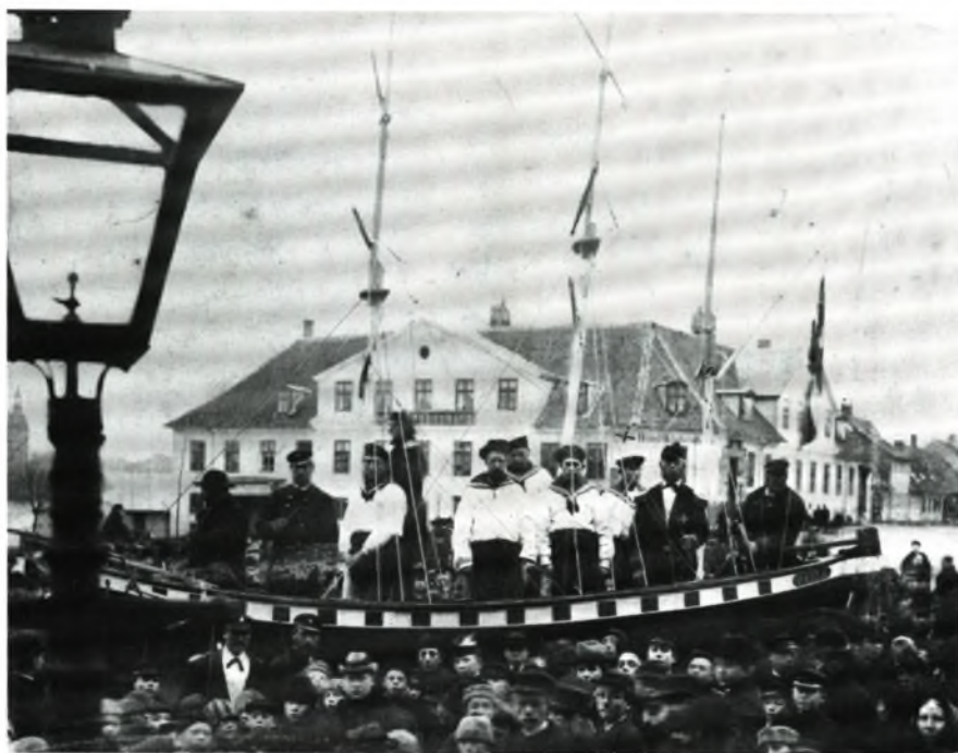
Slettenfiskerne med „fregatten“ på torvet i Hillerød 1878