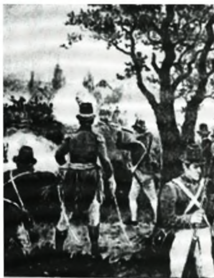
Illustration til drengbogen „En helt fra 1807“ udgivet i 1921.