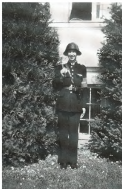
Forfatteren på vagt foran Hvilehjemmet d. 5. maj

På vej til en anden mulighed gik det galt. Vi var dårlig nok kommet rundt om hjørnet af gaden ud mod