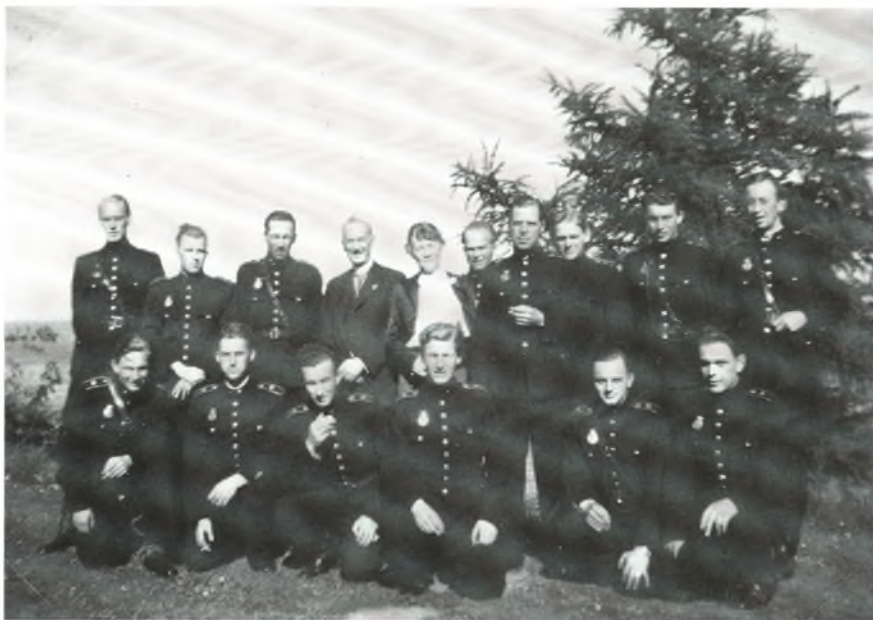
På besøg i en privat have i Humlebæk

hurtigt fart på hestene. Dog var han noget skræmt, for da vi kom på den anden side af en nærliggende viadukt, bad han mig stå af, men nu var der også åbent land med hegn og hække, der gav mulighed for at komme i skjul. Siddende her, følte jeg mig nogenlunde i sikkerhed, jeg så også længere væk nogle personer, der var på vej ned til nærliggende gårde. Da de ikke kom tilbage, gik jeg så godt skjult som muligt ned på gården, hvor der nu var tre kolleger.