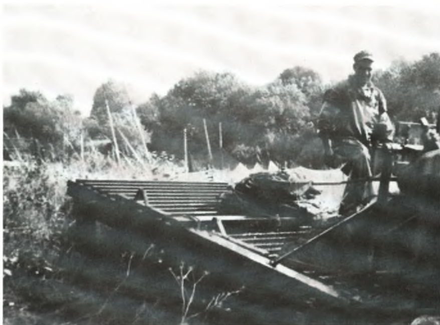
Humlebæk fiskerne arbejder ved tjære-ladet omkr. 1950 (Flynderupgård)