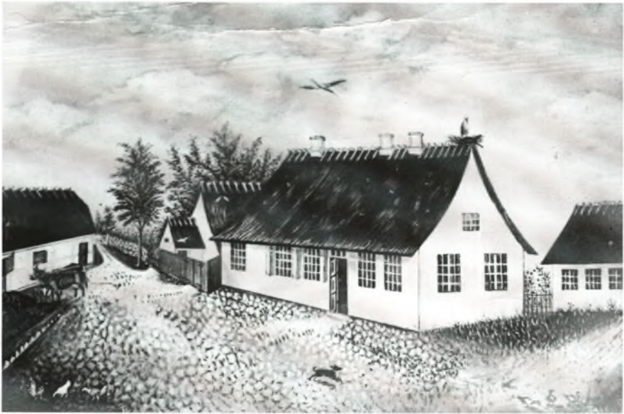
Tegning af skolen formodentlig før udbygning i 1843 (LHA)

de ældre elever kunne undervise de yngre, og derved kunne samfundet spare på lærerlønnen.