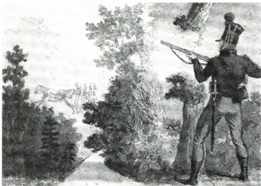
Maleri: En Livjæger rammer en engelsk officer til hest. Dansk Folkeblad 10. juni 1842.