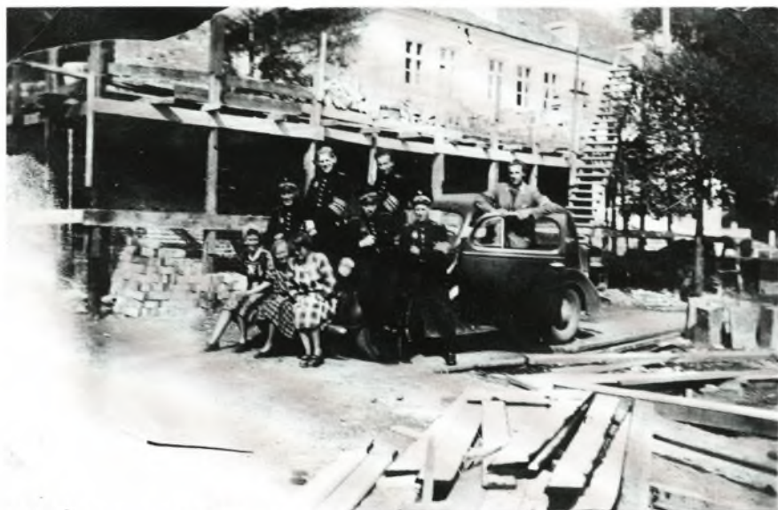
Nogle personer fra Søholmgruppen foran Krogerup i foråret 1945

færd har vi sikkert også medvirket til det, der skete den 19. september 1944.