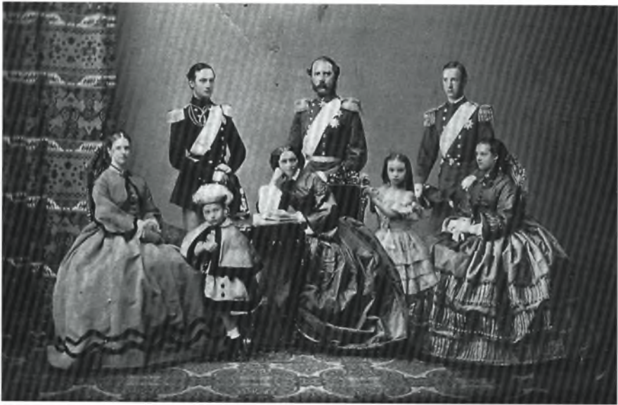
Kong Christian 9. og dronning Louise med børnene, Frederik 1843-1912 (Frederik 8.), Vilhelm 1845-1913 (Georg 1. af Grækenland), Alexandra 1844-1925 (dronning i England), Dagmar 1847-1928 (zarina i Rusland), Thyra 1853-1933 (hertuginde af Cumberland), Valdemar 1858-1939 (admiral i den danske flåde)

havde dette spørgsmål fået en tilfredsstillende løsning. I sin dagbog omtaler H.C.Andersen flere gange besøgene hos tronfølgerparret. Han befandt sig godt i deres hjem med 6 søde velopdragne børn, som han læste sine eventyr for. Således skriver han i sin almanak mandag d. 21. marts 1859: "Læst hos Prinds Christian mine nye Historier; Alle meget hjertelige imod mig" . I dagbogen omtaler H.C.Andersen også et besøg tirsdag d. 11. december 1860: "Om Aftenen hos Prinds Christians... Prinsesse Alexandra og de andre Børn rakte mig Haanden. Tronfølgeren Pinds Frederik fulgte