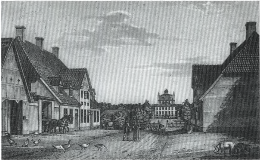
Tegning af Stor Kro og rejsestald 1825 Fattig Holm. Lokalhistorisk arkiv Fredensborg

skoler samt en håndgerningsskole for 33 piger.