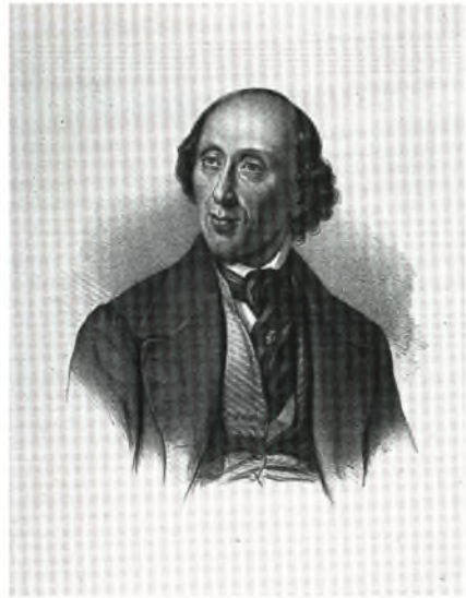
H.C.Andersen 2. april 1805 - 4. august 1875