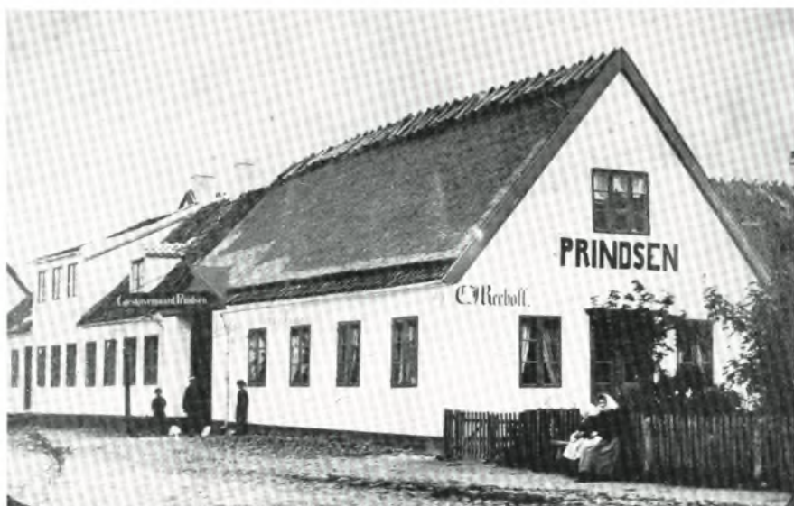
Gæstgivergården Prinsen Slotsgade 8. Her boede H.C.Andersen under sit besøg i Fredensborg 21. juli 1864.

Torsdag d. 21. juli 1864 besøger H.C.Andersen første gang Bournonville i Fredensborg. Han, der var begejstret for alle tekniske fremskridt, kører med den nye jernbane. Gennem dagbogen giver han en levende beskrivelse af turen og opholdet i Fredensborg. "Tog Klokkeren halv tolv med Toget fra København til Fredensborg..." ; Ankomsten til Fredensborg søgte han først at få logi på en af byens kroer, men her er ikke rent nok, så han besluttede sig for et værelse på hotel Prinsen: ... "søgte hen i Prindsen,