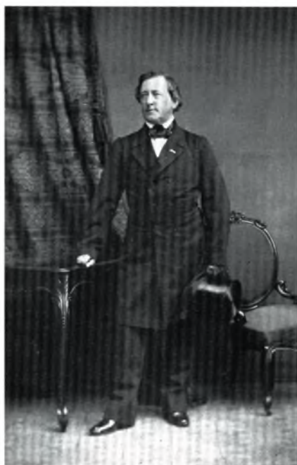
August Bournonville 21. august 1805 - 30. november 1879

August Bournonville optrådte første gang ved Den kongelige Ballet i 1813. Han fik en alsidig uddannelse ved balletten i Paris i 1820'erne. 1830 vendte han tilbage til København, hvor han virkede som solodanser, balletmester og koreograf til 1848. Som balletmester fortsatte han til 1877 kun afbrudt af ophold i Stockholm og Wien.