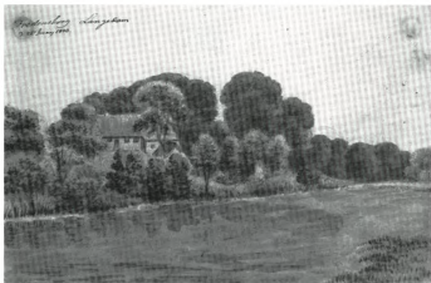
Akvarel af Ole Jørgen Rawert: Udsigt over Fredensborg Langedam 1840 Rawerts billedsamling Det kongelige Bibliotek

Topografen S. Sterm skrev i 1831 om byen: "Ved Slottet ligger en lille Flække eller Landsby af samme Navn; den tæller omtrent 500 indbyggere. Flækken der er velbygget og brolagt..." 6) Han fortæller her efter om hvad beboerne lever af, lidt agerbrug og lidt handels- og håndværksvirksomhed, der er en mindre klædefabrik i byen. I 1831 var her blevet opført en almueskole, så der nu var skole på slottet og en skole ude i byen. Dertil 2 privat-