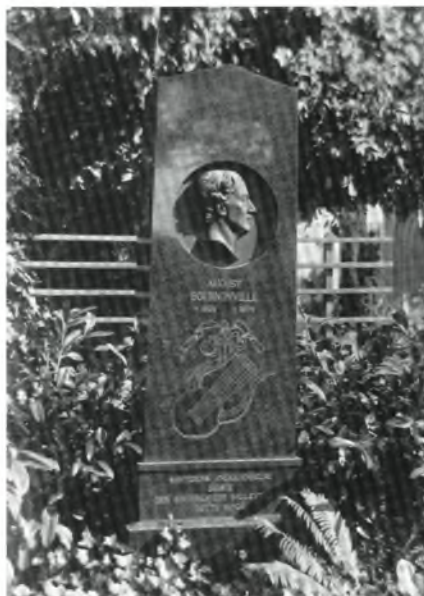
August Bournonvilles gravsten på Asminde-rød kirkegård. ”SAMTIDENS ANERKJENDELSE REISTE DEN HØJTBEGAVDE BALLETMESTER DETTE MINDE”