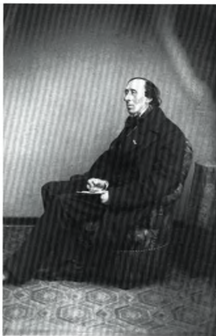
H.C.Andersen.

Byen tiltaler ham ikke, den er kedelig, han har fra sit værelse på Prinsen udsigt til et kedeligt gårdsrum. Parken finder han kedelig og