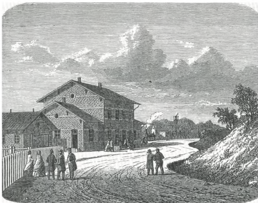
Banegaarden ved Fredensborg.

Fredensborg station. Billede fra Illustreret Tidende. Jernbanen fra København til Helsingør blev indviet 8. juni 1864. I 1866 blev stationen udvidet med den kongelige ventesal. Lokalhistorisk arkiv Fredensborg