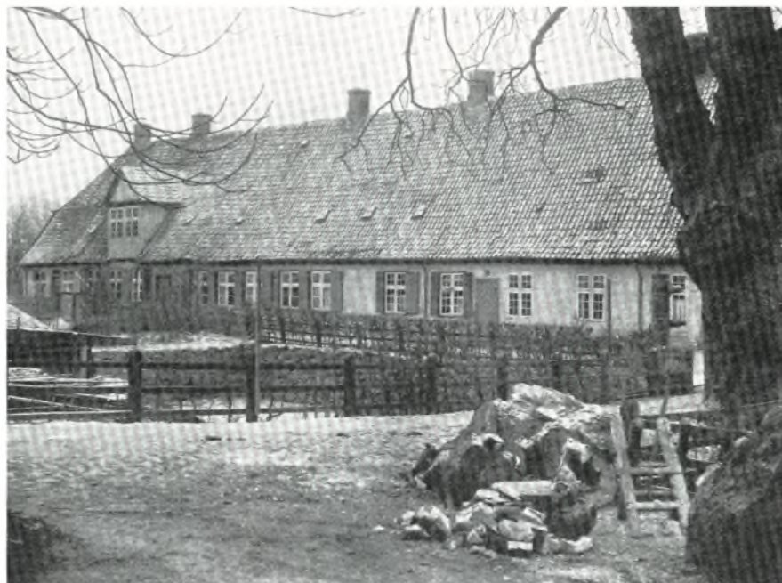
Røde Længe ved Fredensborg slot. Her boede Frederik Paludan Müller om sommeren fra slutningen af 1840erne til sin død 1876.

yderligere forværret med grundloven af 1849. Slottets beboere betragtede det som en menneskeret at have fribolig, så det kom som et chok for dem, da Indenrigsministeriet havde overtaget slottet, og alle fik en opsigelse med besked om, at ville de blive boende, måtte de betale husleje. Der opstod stor opstandelse, der blev sendt bønnekrift til Indenrigsministeren, men det hjalp ikke, selv om nogen havde haft fribolig i 50 år. En følge af statens overtagelse var også, at der blev givet tilladelse til megen forskellig brug af slottets lokaler. Da man skulle afholde det første rigs-