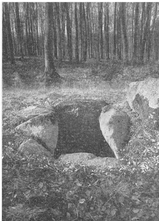
Det aabne Kammer før Dækstenen blev lagt paa Plads.

Langside med en lavere Tærskelsten ved Indgangen fra Syd. Nordenden af Kamret bestaar af en Opstabling af mindre Sten.