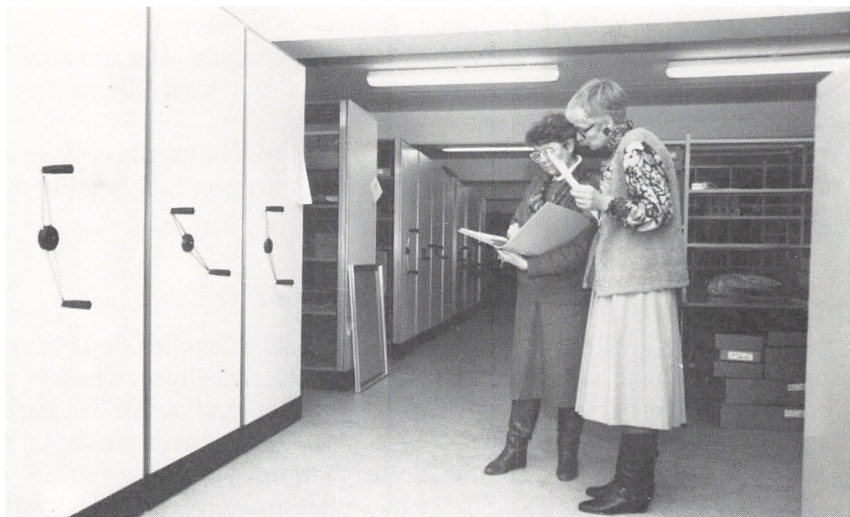
Arkivmagasin, Greve Lokalarkiv

Regnskaber, korrespondance, lagerfortegnelser, lønningsbøger, ejendoms papirer og fotografier kan være med til at fortælle om produktion og afsætning samt de ansattes forhold.