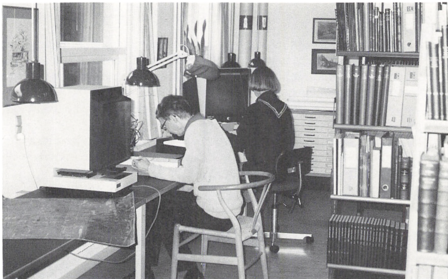
Læsesal, Roskilde Lokalhistoriske Arkiv

De lokalhistoriske arkiver arrangerer også ture i området, deltager i udstillingsvirksomhed, udgiver lokalhistoriske bøger, holder foredrag, deltager i lokalradioernes oplysningsvirksomhed og meget mere.