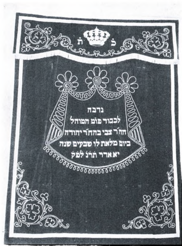
Fig. 3. Thorashabshforhæng 224 × 167 cm brunfarvet fløjlsbroderet med guldtråd. Det blev skænket forstanderen i Fredericia 3. Marts 1890.

Af minder fra selve synagogen har Fredericia Museum kun et stykke af en af de højryggede stole samt en „stænder“, d. v. s. en bedepult der stammer fra før 1865. Endvidere har man synagogens tre nøgler, der som stadfæstelse af salget blev overleveret køberen C. M. Cohr den 21 Februar 1914. Alle de værdifulde hellige genstande blev straks i 1902 overført til det mosaiske samfund i København, hvor der var blevet indrettet et mosaisk museum i tilslutning til biblioteket Ny Kongensgade 6. De hellige Thoraruller opbevaredes dog i synagogen i København, hvorfra en del senere er skænket til de nye jødiske menigheder i Israel.