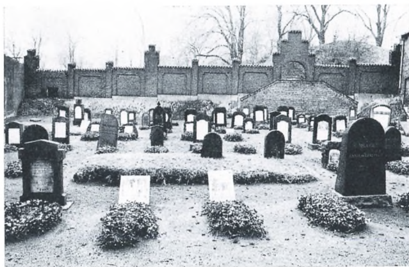
Fig. 9. Den nyere del af kirkegården ved Vestervoldgade. De mange ens gravstene med ovalt vedbenbæd foran giver kirkegården sit særpræg.