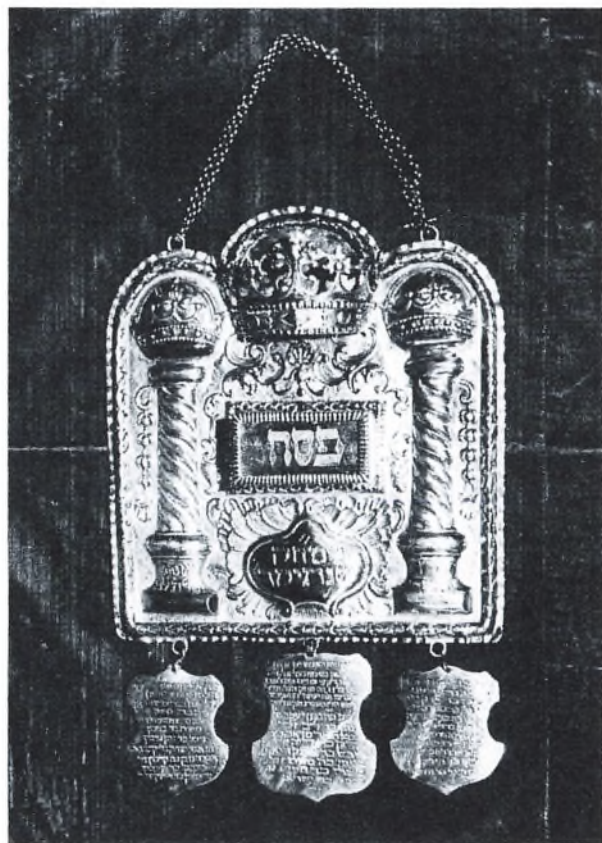
Fig. 2. Thora-skjold af sølv til at hænge som en prydelse over den sammenrullede Thora-rulles to stokke. På de tre plader fornedes står navnene på de 37 jøder, der var medlemmer af det jødiske begravelsesselskab ved dets 25-års jubilæum i 1749.