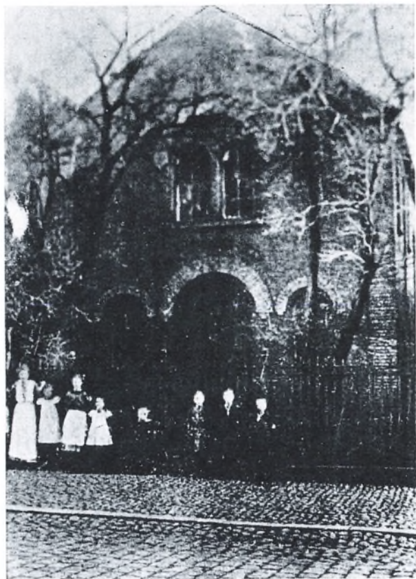
Fig. 1. Synagogen i Fredericia o. 1890.