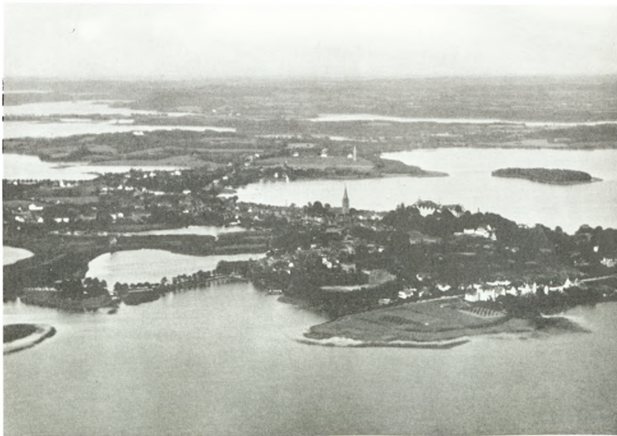
Byen Plön og omegn.