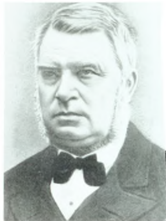
Kommandor T. C. E. T. Rosenqvist. Født 1817, død 1885. Side 33