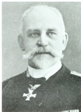
Kommandor Thoralf Rosenqvist. Født 1857, død 1921. Side 38