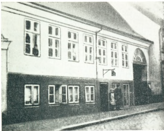
Garvergaarden i Nykøbing Sjælland.

Gennem Aarene har min medfødte Slægtsfølelse vokset sig dybere og inderligere, og som et Resultat heraf foreligger denne lille Slægtsbog, som jeg herved som en Gave overgiver til Slægten i Haab om, at den maa blive modtaget med Velvilje og videreført af kommende Generationer.