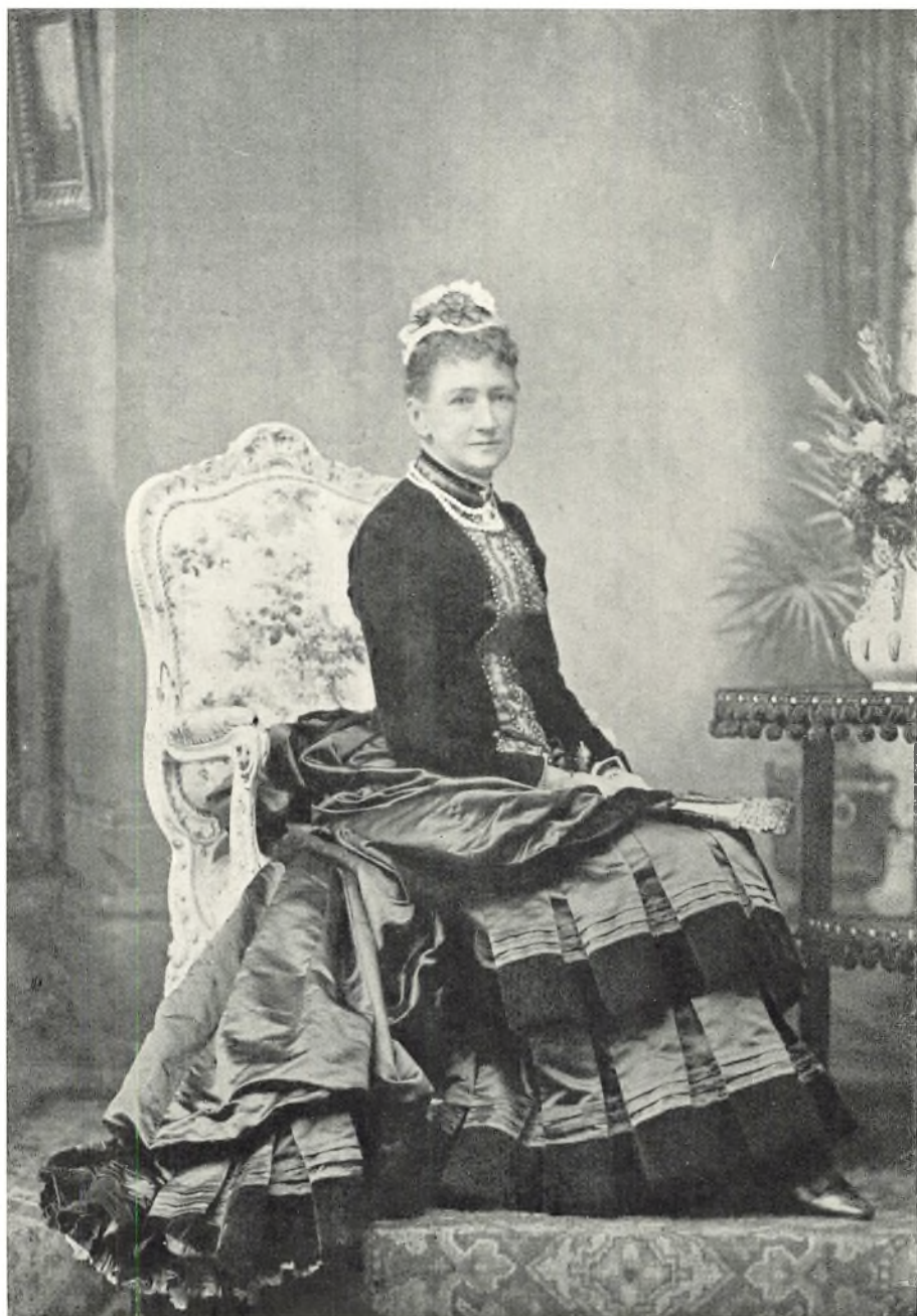
Dronning Louise (1817—1868) der sammen med Kong Christian IX var Midtpunktet for Familiekredsen paa Fredensborg.