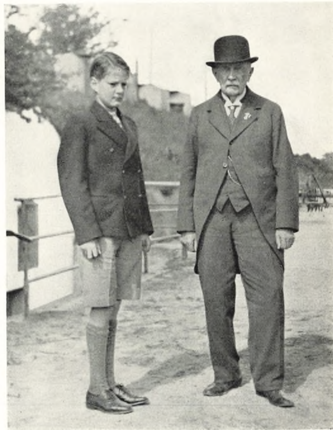
Oldebarn og Oldefader. Grev Erik Holstein og Forfatteren. Billede fra 1936.