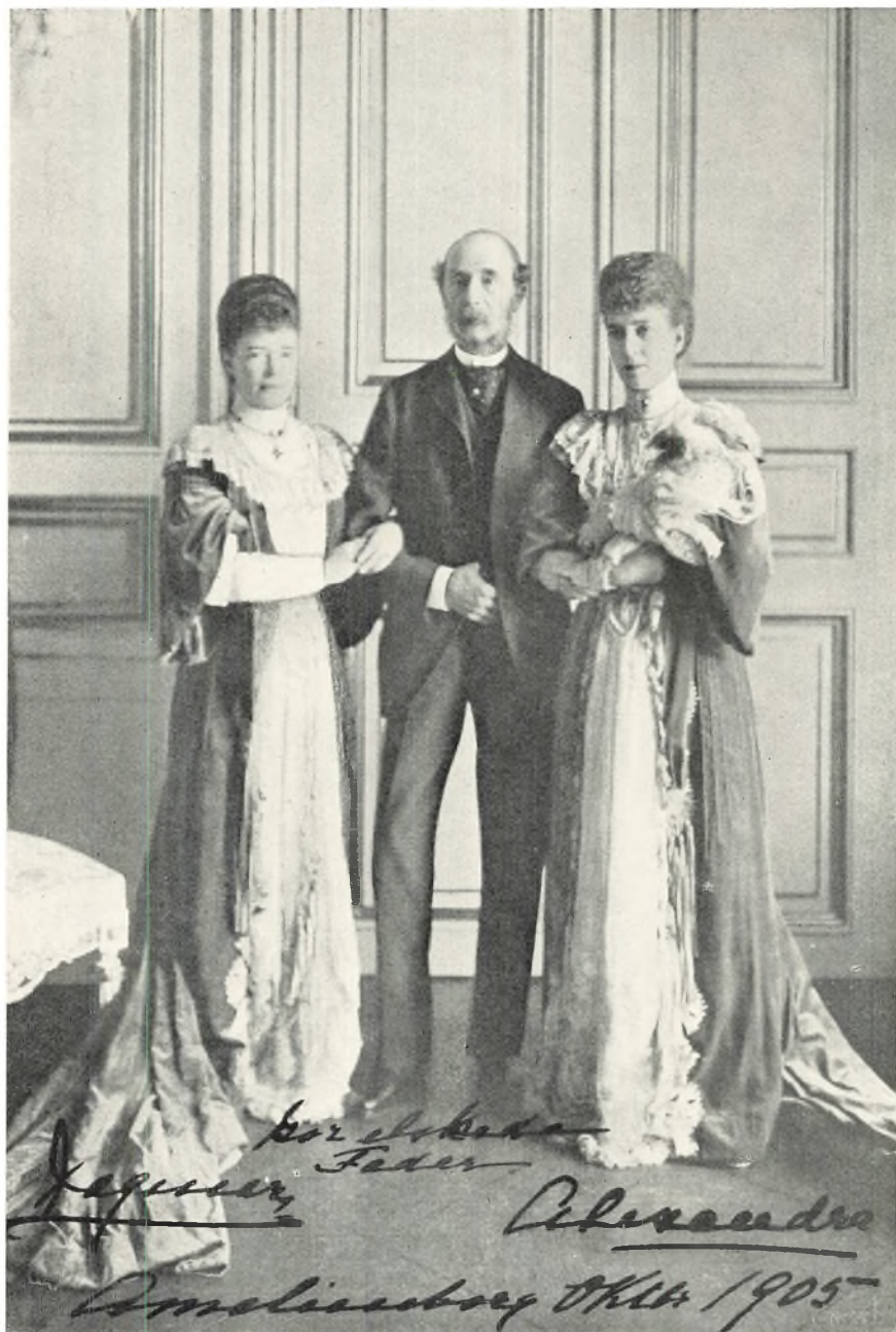
Kong Christian IX med sine to Døtre, Kejserinde Dagmar af Rusland og Dronning Alexandra af England. Fotograf fra 1905.