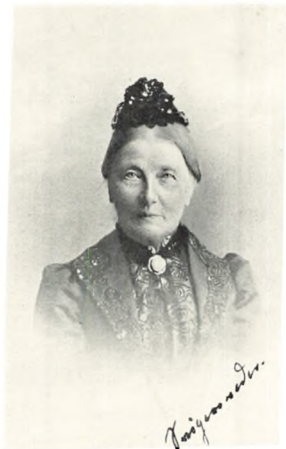
Baronesse Frederikke Wedel-Jarlsberg, f. Benzon (1821—1916). Forfatterens Svigermoder.