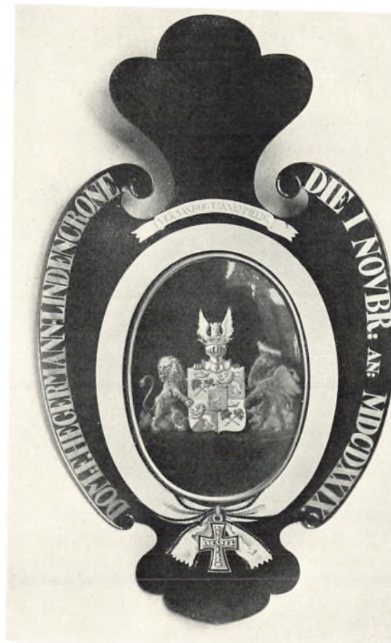
1. November 1929 udnævntes Forfatteren til Storkorsridder af Dannebrog i Anledning af sit 70aarige Officersjubileum. Paa Billedet ses til højre Vaabenskjoldet med Forfatterens Valgsprog: Vær sand og taknemmelig.