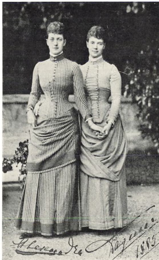
Prinsesse Alexandra af Wales og Kejsersinde Dagmar af Rusland. Billede fra 1885.