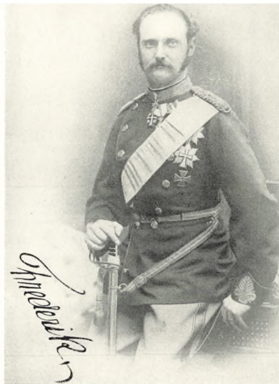
Kong Frederik VIII som Kronprins.