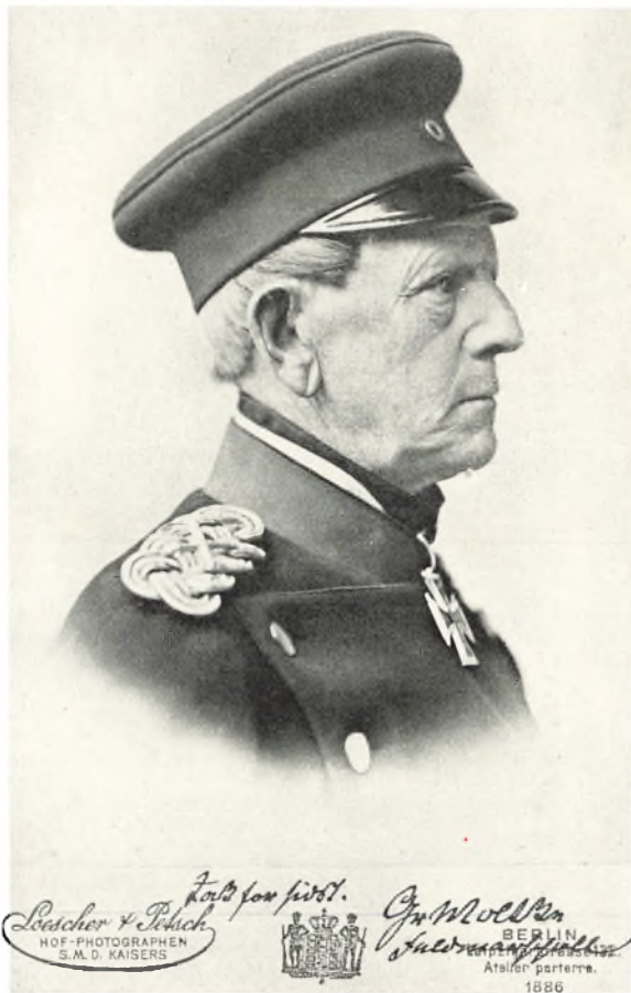
Generalfeldmarschall Helmuth v. Moltke (1800—1891).