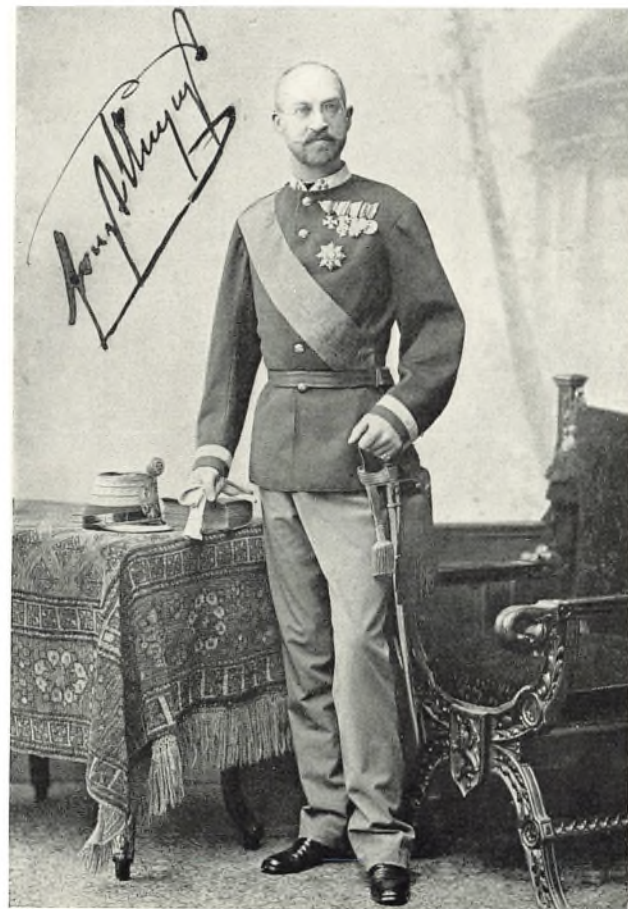
Hertug Ernst August af Cumberland (1845–1923).