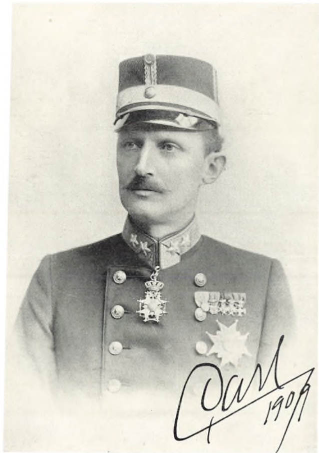
Prins Carl af Sverige.