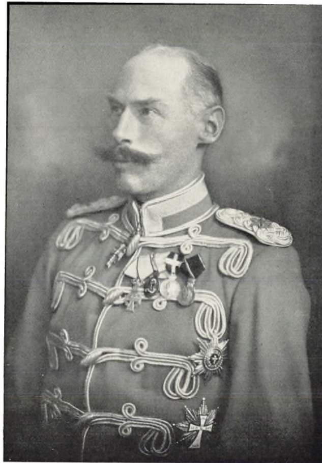
Prins Harald af Danmark.