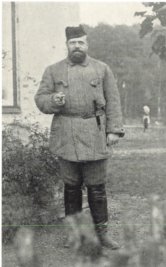
Zar Alexander III af Rusland. Billede fra 1885 taget paa Fredensborg.