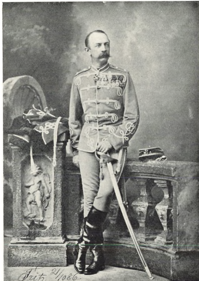
Forfatteren som Chef for Gardehusarregimentet 1886.