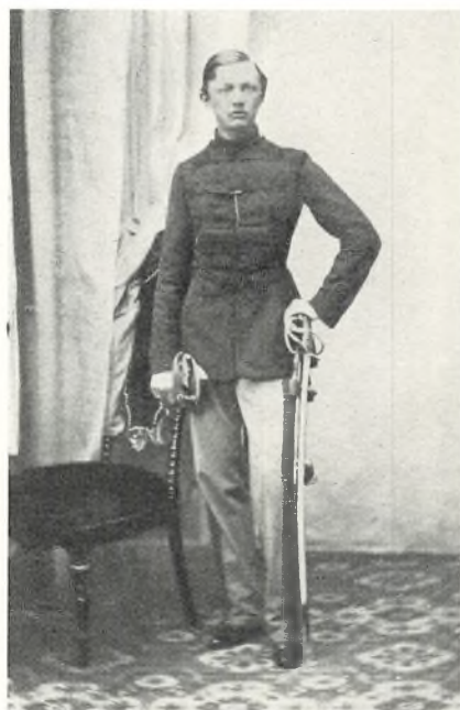
Forfatteren som 22-aarig Løjtnant i Næstved (1862).