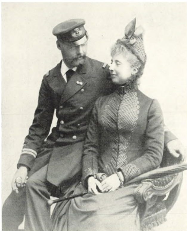
Prins Valdemar og Prinsesse Marie. Billede fra ca. 1890.