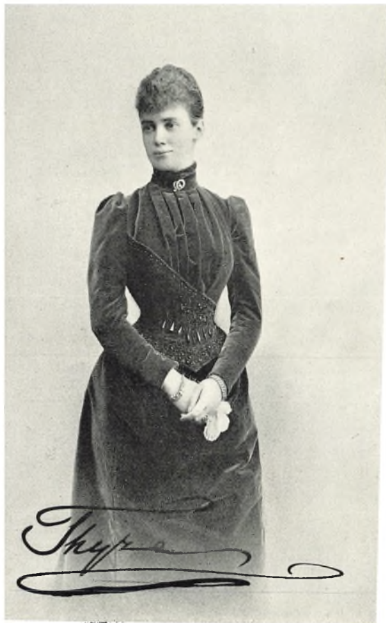
Hertuginde Thyra af Cumberland (1853–1933).