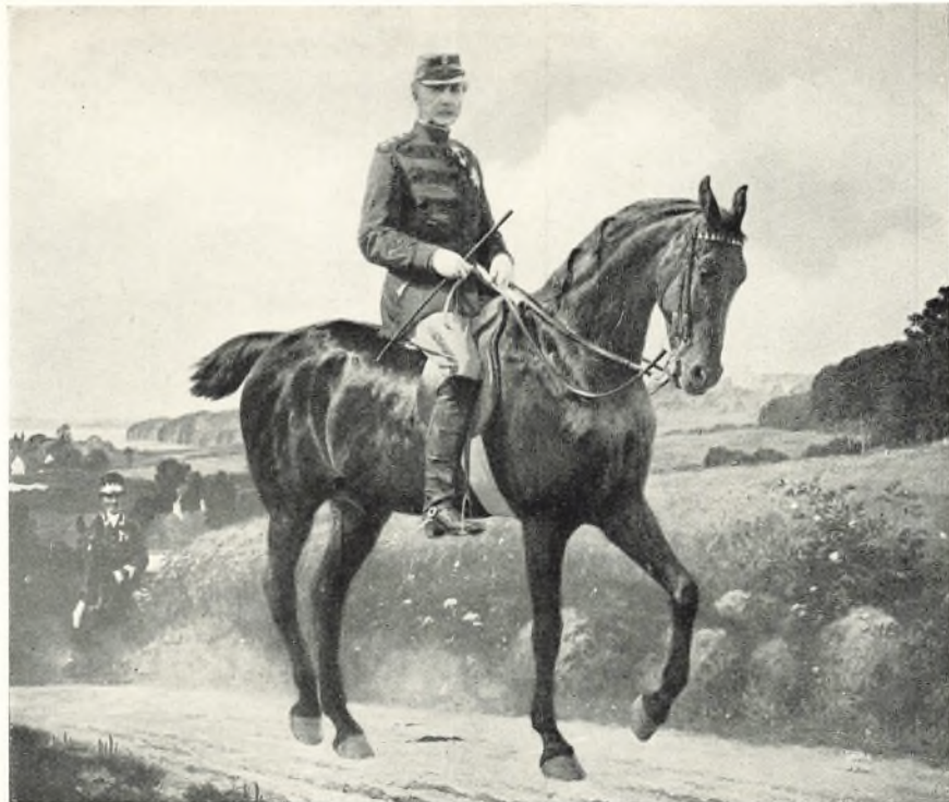
Kong Christian IX.