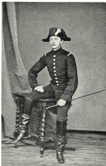
Forfatteren i fransk Saumur-Uniform 1863.