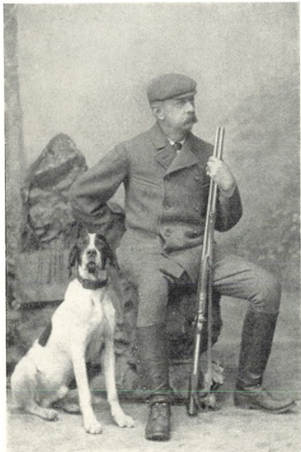
Forfatteren som Jæger med Hunden „Prick“. Billede fra 1898.