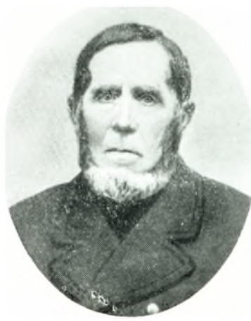
Min Far (78 Aar)