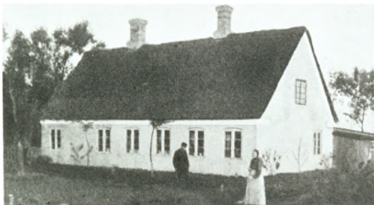
Lundvadgaards Aftægts hus.