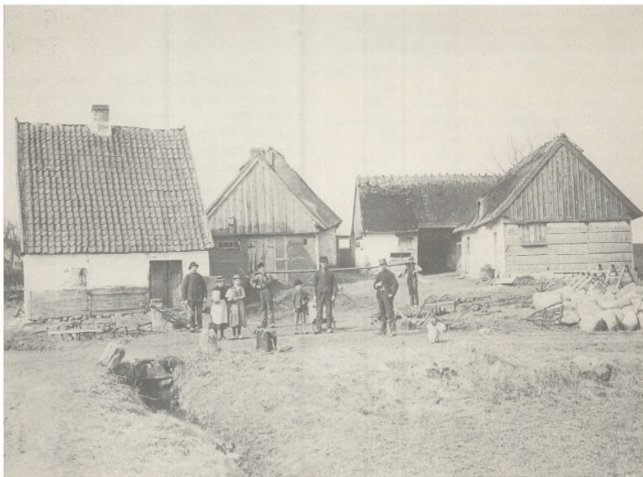
Stenløse gamle smedie 1896 set mod nordvest. Grøften i forgrunden er bygadens nordre gade- grøft. (matr. 57 a).