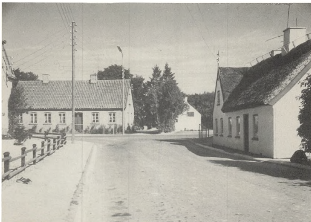
Toftholmvejs udmunding i bygaden 1968. Huset til højre indeholder måske endnu elementer af den gamle kro. Bemærk hvor højt bygaden ligger i forhold til samme hus.