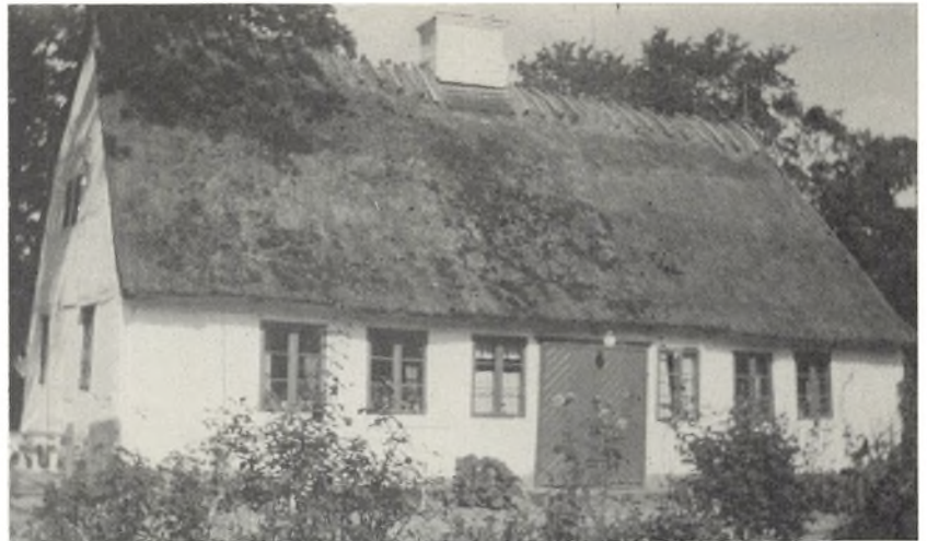
Enkesædet set fra sydsiden ca. 1940.