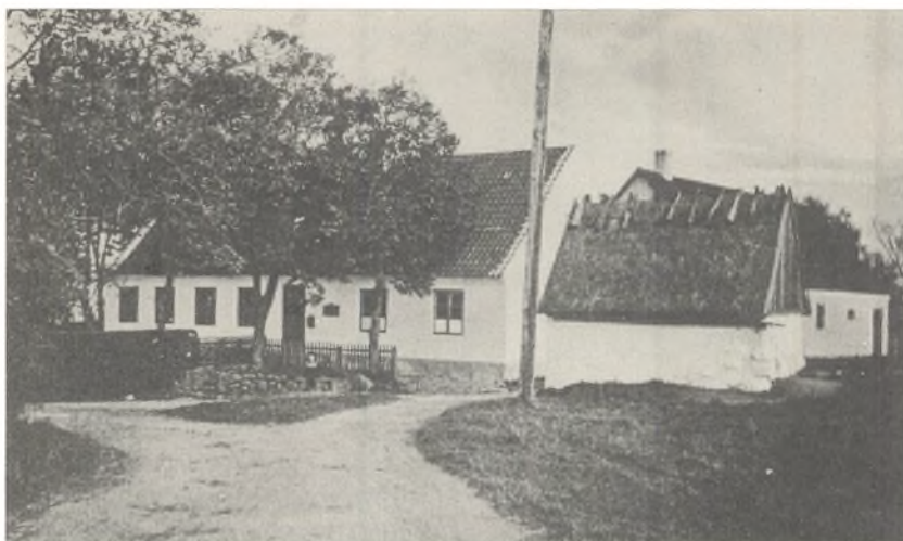
Søsum rytterskole ca. 1905. Det lille hus i forgrunden, på hjørnet mellem vejene til Stenløse og Veksø, var Søsum by's sprøjtehus.