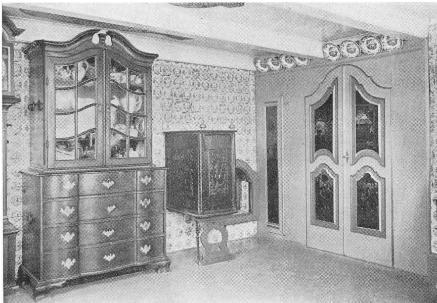
Det nordøstlige Hjørne af søndre Dørns

gamle skinner igennem paa en Maade, saa det er muligt at genkonstruere Husets oprindelige Skikkelse.