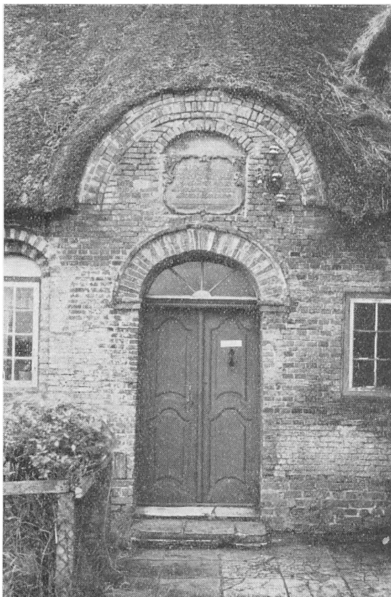
Indgangsdør i Stuehusets Nordfacade