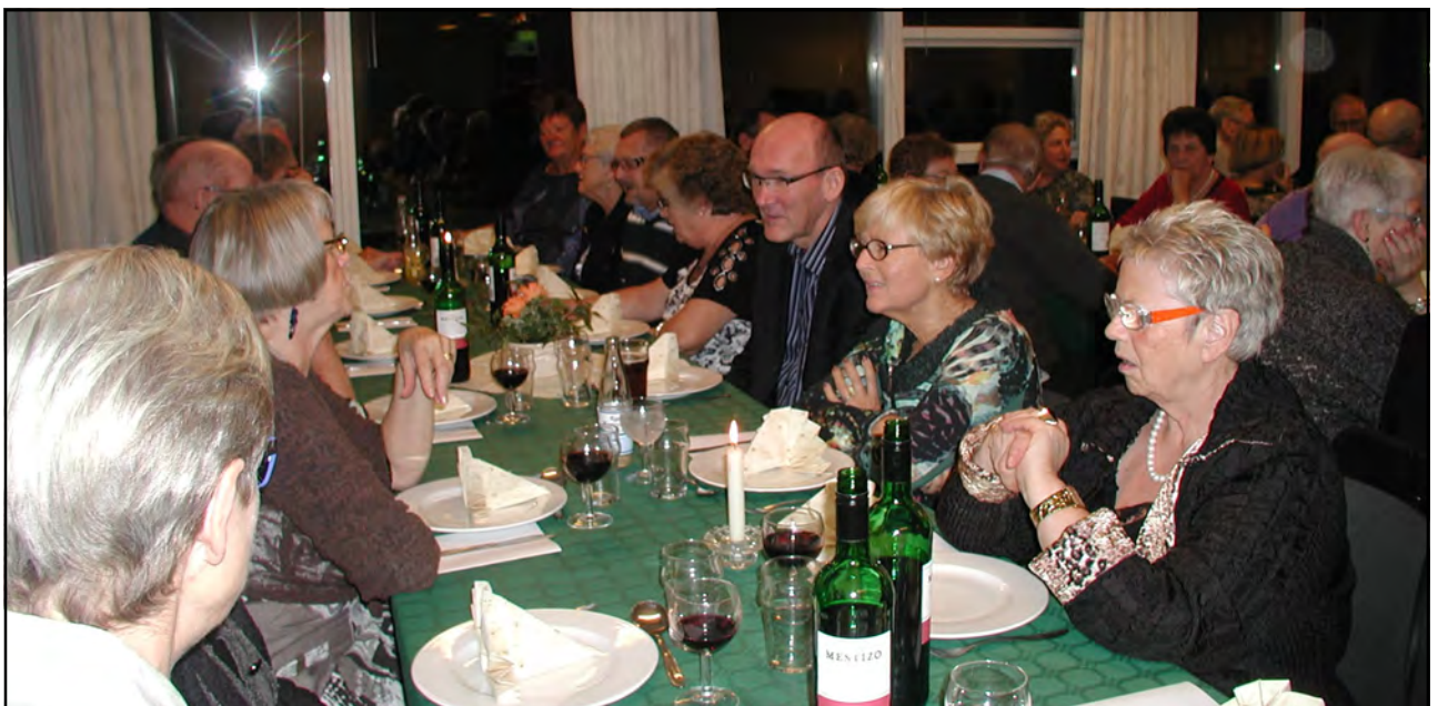
Fra sidste års Mortens aften