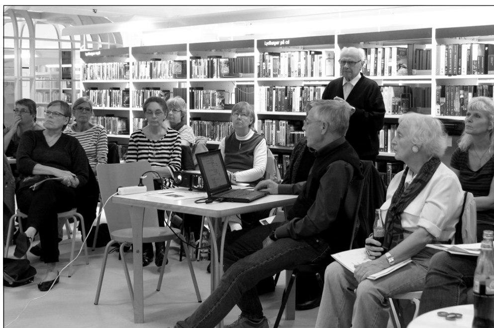
Der var godt besøg da vi afholdte "Find dine aner" på biblioteket