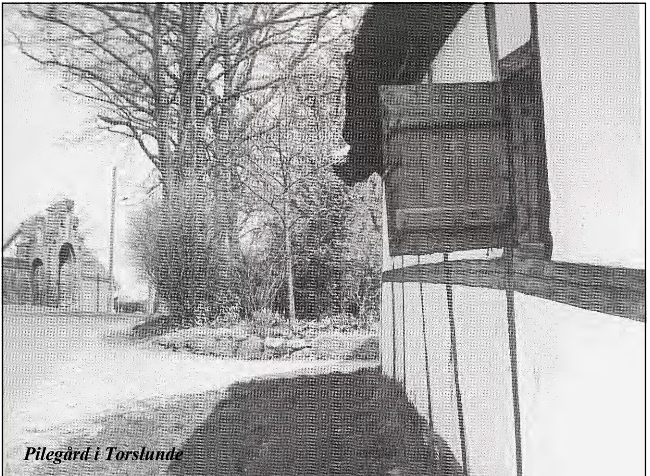
Pilegård i Torslunde

Ved hver af kilderne var bygge et bassin på 10 til 20 kvadratmeter på tilhuggede planker, og udenom var der et tykt lag strandsand og en række stampesten. Også i bassinernes bund lå et tykt lag strandsand, som gennem tiderne var skyllet op med vandet, og det vidnede om fjerne tiders nære forbindelse med havet. Vanddybden var kun ringe, ca ½ meter. I et hjørne var der en sænkning, hvor vandet løb over og ud i Lille Vejleå. Vinteren igennem blev kreaturerne på byens gårde, hvordan vejret end var, løst i båsene, og gik så selv ad en bestemt vej ned til kilderne og drak