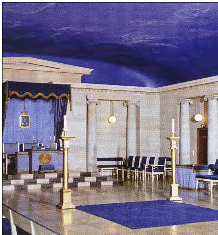
En sal med blå himmel med stjernetegn

Der findes mange loger i huset med hver sit navn. Der var ophængt de forskellige logers og medlemmers symboler, der bestod af en slags våbenskjold. Der kan fortælles meget mere om denne spændende tur, så vi kan kun opfordre andre til at besøge Frimurerlogen, hvis man har mulighed derfor.