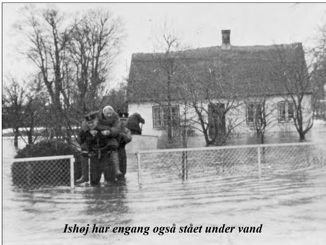
Ishøj har engang også stået under vand