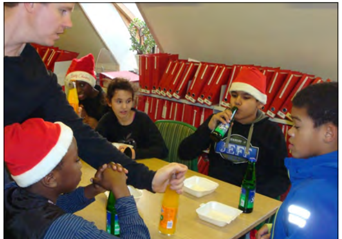
Sangerne blev beværtet på arkivet

Som noget nyt var der juleklip for børn og voksne på arkivet. Det viste sig at være en stor succes, da alle pladser var fyldt op der meste af dagen.