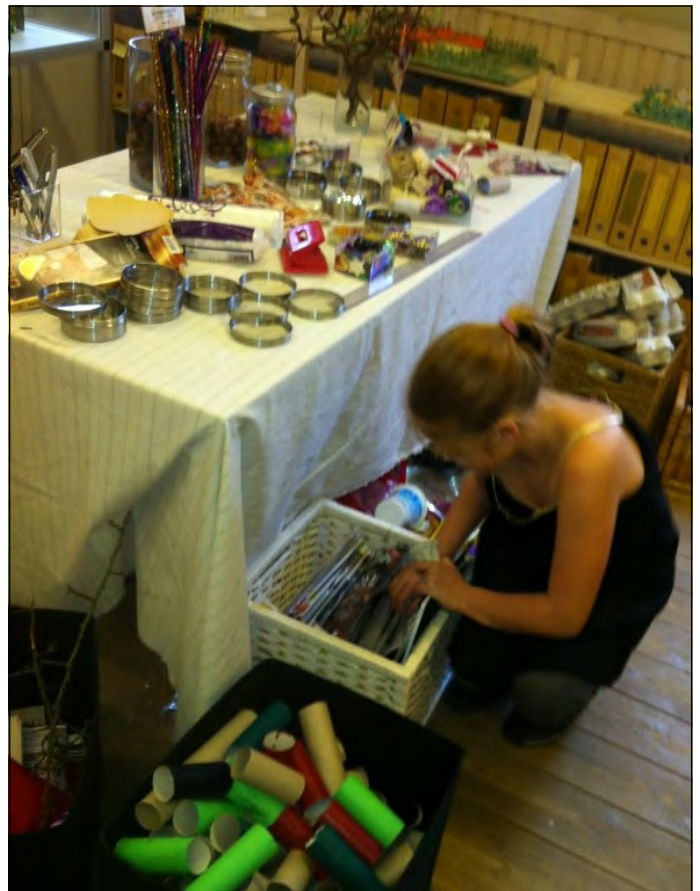
Der var mange ting til at lave julestads af

Fra februar 2014 kan børnefamilier tage bedsteforældre, naboen og andre venner med til afslappende søndagshygge på Bredekærgård 1. søndag hver måned. Her kan der nydes kaffe, te, saft, mælk og hjemmebag til billige penge. Der må også gerne medbringes madpakke. Til arrangementerne er der altid aktiviteter for børn i alle aldre; der kan tegnes klippe/klistres og spilles spil fra "gamle dage", der er forskellige udendørs aktiviteter og der kan hilses på gårdens katte, geder, kani-ner og høns. Derudover er der forskellige lokalhistoriske temaer med sjove aktiviteter på programmet. Vær med.