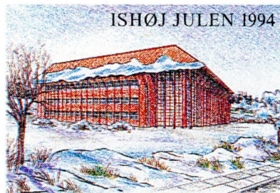
• HANDELSSKOLEN I ISHØJ •

Ishøj Kommune tog initiativet til at skaffe handelsskolen tidssvarende lokaleforhold. Opgaven lød: "Der skal laves en velfungerende og markant handelsskolebygning". Denne opgave løste arkitektfirmaet Holm Niensens Eftf. fra Odder, og efter en byggeperiode på kun 11 måneder kunne bygningen på Vejlebrovej, som er dette års motiv på det lokale julemærke, tages i brug i maj 1989. Allerede i 1991 voksede skolen ud af lokalerne på Vejlebrovej, og det har - paradoksalt nok - været nødvendigt at leje sig ind i Bycentret igen. Netop her ved juletid i 1994 er vi i gang med overvejelser om, hvordan vi kan skaffe yderligere plads. Det første, der møder en, når man kommer ind på skolen, er de mange PH koglelamper, der danner en lysende spiral, som er med til at skabe