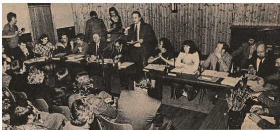
Fra det konstituerende møde i Ishøj Forsamlingshus

var direktør i BP. Han ville gerne gøre en indsats i kommunalbestyrelsen. Det var et dejligt modspil at få – en der